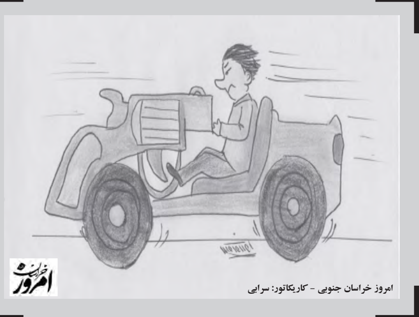
امروز خراسان جنوبی - کاریکاتور: سرایی

چهاردهمین دوره انتخابات ریاست جمهوری به ایستگاه پایانی رسید و مانند دوره‌های اخیر شاهد برگزاری مناظره‌های تلویزیونی بودیم. مناظره‌هایی که در آن نامزدهای انتخابات کناره هم می‌نشستند و علاوه بر بیان برنامه‌هایشان در سرفصل‌های مطرح شده اقدام به اتهام زنی به رقبای نقد برنامه‌هایشان می‌کردند. بخش اول که بیان برنامه‌های داوطلبان بود، امری مبارک و قابل تحسین می‌نمود و همچنین بخش آخر که موضوع نقد برنامه‌های سایر داوطلبان بود نیز می‌توانست فضایی برای انتخاب اصلاح را برای مردم فراهم سازد، اما در قسمت دوم که موضوع اتهام زنی نامزدها به یکدیگر بود، هر چند در این دوره کمتر مشاهده شد اما متأسفانه حذف نشد. با این حال مسئله دارای اهمیت این موضوع است که برخی از نامزدها اقدام به اتهام زنی به کسانی کردند که در صحنه انتخابات به عنوان نامزد و حتی به عنوان عضو ستاد رقیب حضور نداشتند. اما مسئله قابل توجه و قابل تحسین اینجا بود که امسال برای نخستین بار شاهد این امر بودیم که شورای نظارت بر برنامه‌های انتخاباتی داوطلبان در صدا و سیما در مواردی که از افراد حقیقی در برنامه‌های تلویزیونی و یا مناظره‌ها نام برده شده بود، خواست تا به میزانی که درباره آنها صحبت شده است، دفاعیاتشان را به صورت ضبط شده در اختیار این شورا قرار دهند تا از شبکه‌های سراسری پخش شود. این اتفاق می‌توانست سنگ بنایی مبارک باشد برای ساختن جامعه که بر این پی ساخته خواهد شد و احتمالاً در دوره‌های بعد شاهد این خواهیم بود که داوطلبان هنگام اظهار نظر درباره اشخاص ثالث با دقت بیشتری سخن خواهند گفت. این اتفاق مبارک را به فال نیک می‌گیریم.