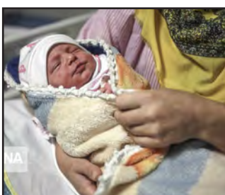
پوشش دانشگاه علوم پزشکی به صفر برسد.

معاون درمان دانشگاه علوم پزشکی بیرجند تصریح کرد: کاهش میزان مرگ و میر مادران یکی از شاخصهای مهم