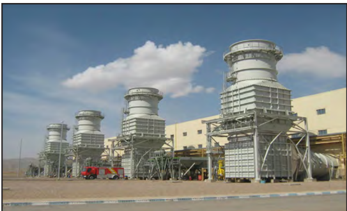
ماجرای نشده ایم.

تعهدهات وزارت نیرو بابت احداث نیروگاه‌های سیکل ترکیبی (خصوصی و دولتی) پرداخت و هزینه می‌شود.