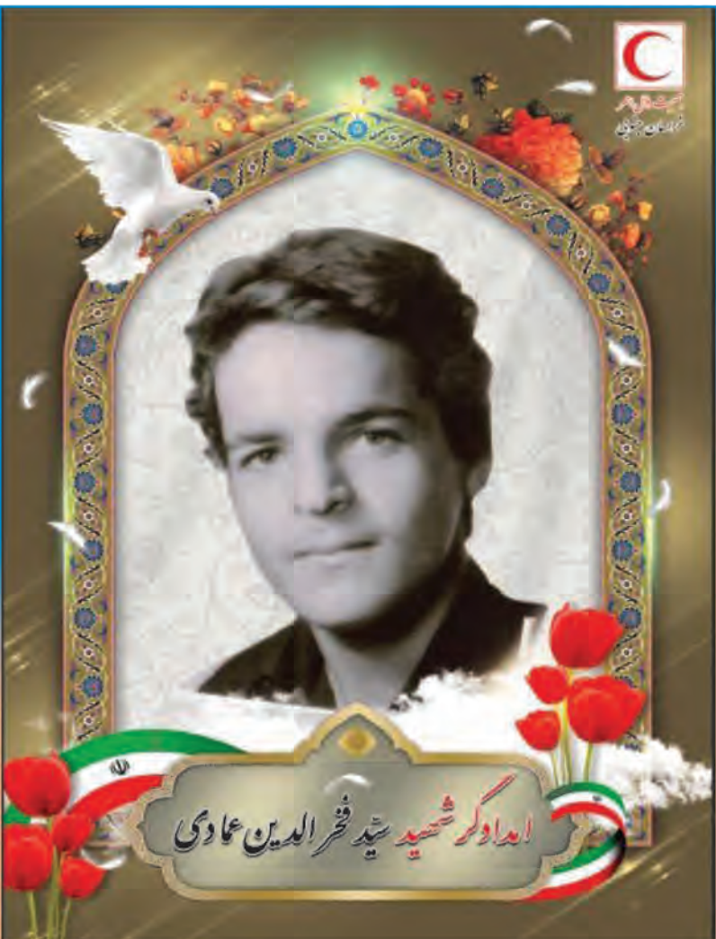
اعدادگر شهید سید فخرالدین عمادی