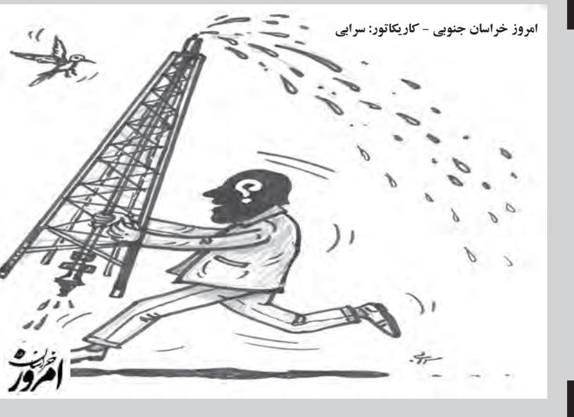
امروز خراسان جنوبی - کاریکاتور: سرایی