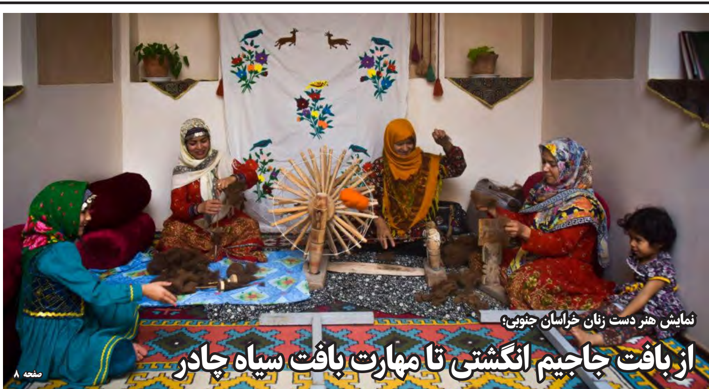
نمایش هنر دست زنان خراسان جنوبی؛

رئیس مرکز حل اختلاف قوه قضائیه گفت: راه اندازی دادگاه صلح از یک ماه آینده در استان‌های کشور آغاز می‌شود. حجت الاسلام صادقی افزود: دادگاه‌های صلح با این هدف که بیشتر پرونده‌های قضایی مردم با صلح و سازش خاتمه یابد تا آذر امسال در سراسر کشور راه اندازی می‌شود. وی ادامه داد: شوراهای حل اختلاف در کنار دادگاه صلح قرار می‌گیرند و ابتدا دعاوی در این شوراها بررسی و تلاش می‌شود به صلح و سازش منجر شود؛ اما در صورتی که به هر دلیل به سازش نرسند، قاضی دادگاه صلح، رای لازم را صادر می‌کند. وی با بیان اینکه فلسفه وجودی این دادگاه صلح و سازش است، اضافه کرد: آرای دادگاه صلح، تک مرحله‌ای و قطعی است و به همین علت موجب افزایش سرعت کار و کاهش مراحل رسیدگی خواهد شد. رئیس مرکز حل اختلاف قوه قضائیه افزود: همچنین به علت وجود شوراهای حل اختلاف در کنار دادگاه صلح، سرعت رسیدگی به پرونده‌ها افزایش می‌یابد.