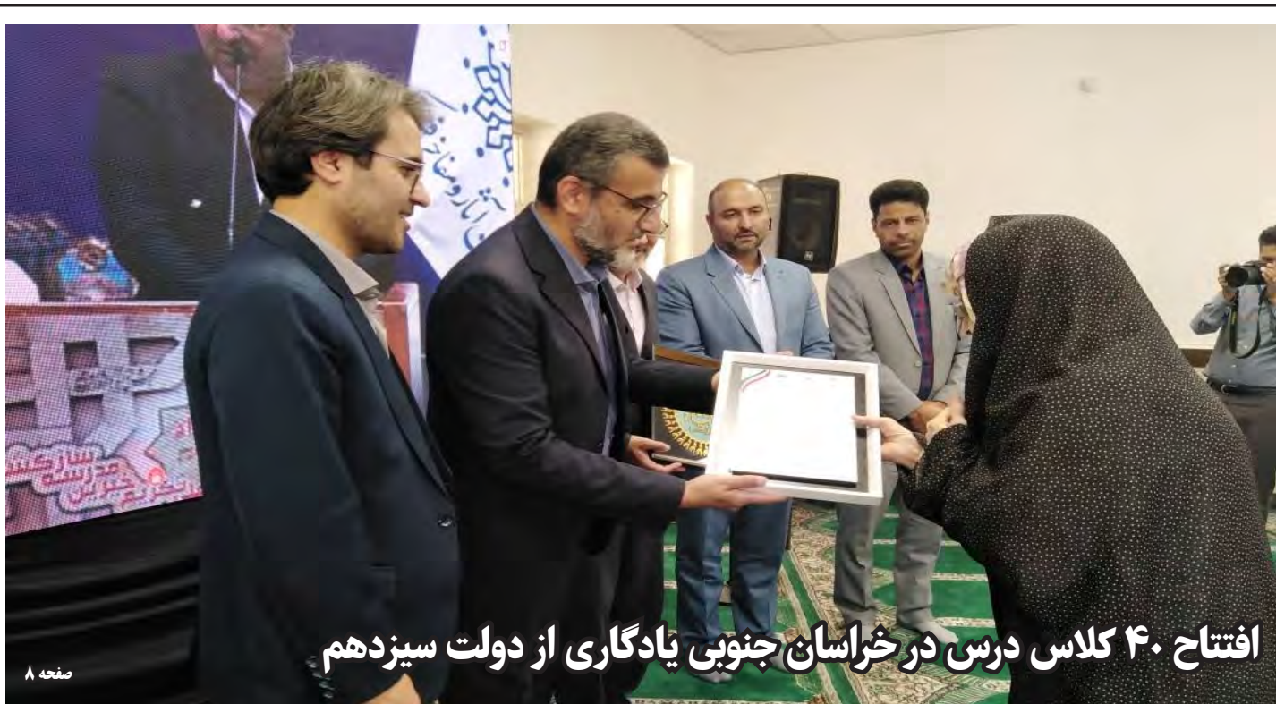
افتتاح ۴۰ کلاس درس در خراسان جنوبی یادگاری از دولت سیزدهم