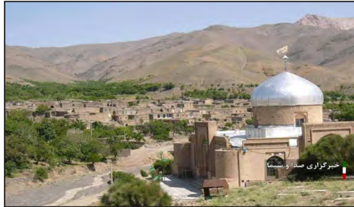
خبرگزاری صدا و سیما

مناطق مرزی از اولویت‌های کشور بوده و جمعیت در این مناطق اغلب، روستاییان و عشایر هستند. مدیریت مهاجرت معکوس به روستاها همواره مورد توجه دولت ها بوده و و شواهد حکایت از افزایش بازگشت جمعیت به برخی روستاهای خراسان جنوبی دارد. مهاجرت به شهرها از ۲۰ سال قبل با شدت تازه‌های خشکسالی گریبانگیر روستانشینان خراسان جنوبی شد و آنان را از روستانشین تولیدگر به حاشیه‌نشین شهرها مبدل کرد به طوری که در آمارهای مسئولان، خالی از سکنه شدن یک هزار و ۸۵۲ روستای استان اعلام شد و زنگ خطر مهاجرت از روستاها به صدا درآمد. براساس بررسی‌های انجام شده در خصوص علل مهاجرت از روستاهای خراسان جنوبی، پدیده‌های اقلیمی از علل اصلی مهاجرت عنوان می‌شود چرا که در ۲ دهه اخیر پیامدهای تغییرات