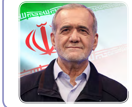
وی اضافه کرد: با توجه به این‌که در مراسم تحلیف مهمان‌های داخلی و خارجی حضور خواهند داشت، لذا مراسم تحلیف رئیس جمهور منتخب احتمالاً نیمه اول مردادماه در مجلس شورای اسلامی برگزار خواهد شد.