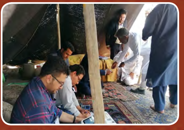
شور و شوق انتخاباتی در سیاه چادرهای عشایری در میان