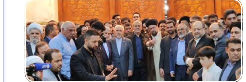
عنوان نهمین رئیس جمهور منتخب جمهوری اسلامی ایران سکاندار هدایت قوه مجریه شد.

جمهوری اسلامی ایران تجدید میثاق کرد. مسعود پزشکیان در جریان برگزاری مرحله دوم انتخابات چهاردهمین دوره ریاست جمهوری در روز جمعه ۱۵ تیر، از مجموع ۳۰ میلیون و ۵۳۰ هزار و ۱۵۷ رأی مأخوذه داخل و خارج ایران با کسب ۱۶ میلیون و ۳۸۴ هزار و ۴۰۳ رأی در مقابل سعید جلیلی با ۱۳ میلیون و ۵۳۸ هزار و ۱۷۹ رأی به پیروزی رسید و به عنوان نهمین رئیس جمهور منتخب جمهوری اسلامی ایران سکاندار هدایت قوه مجریه شد. قرار است در روزهای آینده مراسم تنفیذ حکم رئیس جمهوری به دست رهبر انقلاب اسلامی برگزار شود و سپس با حضور پزشکیان در مجلس شورای اسلامی مراسم تنفیذ او برگزار خواهد شد.