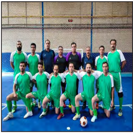
امروز خراسان جنوبی - گروه ورزش