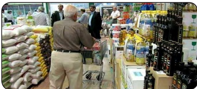
میزان نسبت به مدت مشابه سال قبل تغییری نداشته است.