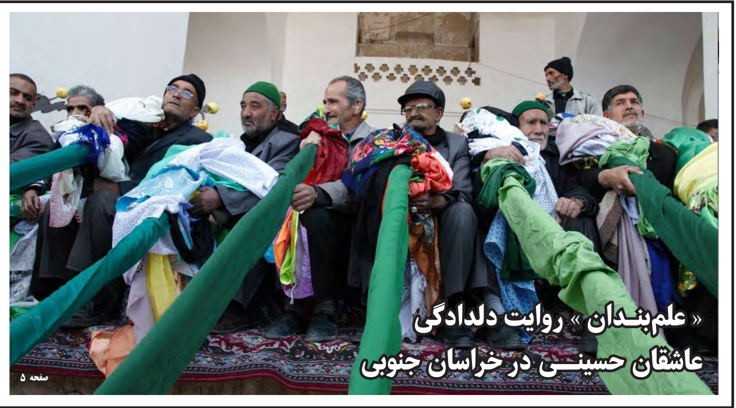
«علم‌پندان» روایت دلدادگی عاشقان حسینی در خراسان جنوبی