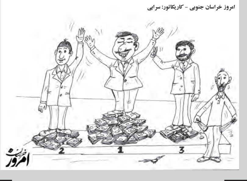
امروز خراسان جنوبی