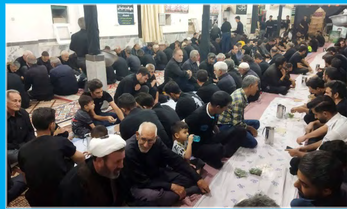
عزاداران حسینی در محل توزیع غذا

امروز خراسان جنوبی - گروه خبر ۲۵۰۰ نفر از عزاداران حسینی به همت سرمایه گذار معادن روی ملوند و ازبکوه اطعام شدند. به گزارش روابط عمومی مجتمع معدنی خراسان جنوبی، همزمان با فرا رسیدن ماه محرم به همت مجموعه فنی و مهندسی سبزیانی، سرمایه گذار معادن روی ملوند و سرب و روی ازبکوه مراسم عزاداری سرور و سالار شهیدان حضرت اباعبدا... الحسین علیه السلام برگزار شد. در این مراسم بیش از ۲۵۰۰ پرس