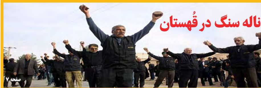
نالہ سنگ در قہستان