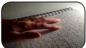
۸۸۱ نسخه بریل و ۵ هزار نسخه کتاب صوتی در کتابخانه های خراسان جنوبی برای روشنندان استان موجود است. مدیرکل کتابخانه های عمومی استان گفت: این کتاب بریل در زمینه های کلیات، فلسفه و روانشناسی، دین، علوم اجتماعی، علوم محض و کاربردی، ادبیات و تاریخ و جغرافیا، ادبیات، ادیان و عرفان، آشپزی، اقتصاد، الهیات، فلسفه، جامعه شناسی، جغرافیا، قصه های کودکان و نوجوانان، معلولیت، مذهبی، علوم سیاسی، علوم تربیتی، عمومی، اسطوره ها، پزشکی، راهنمایی