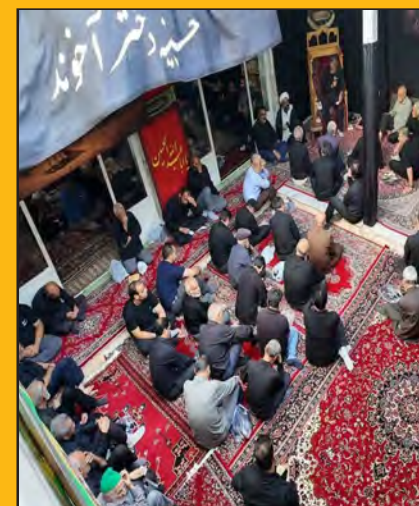
یک قرن میزبانی «دختر آخوند» از عزاداران حسینی