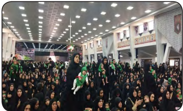
حسین (ع)، حضور بانوان است، به گونه ای که ۹ مادر داریم که فرزندان شان در کربلا بانوانی هستند که در کربلا فرزندان خود را حضرت زینب کبری (س) قرار دارند. حجت الاسلام محمد اسماعیل خورشیدی افزود: شما بانوان امروز ادامه دهنده راه همان بانوانی هستید که در کربلا فرزندان خود را فدای امام حسین (ع) کردند.

بیرجند و آستان امامزادگان باقریه بیرجند میزبان شیرخوارگانی بود که مادرانشان آن ها را فدایی علی اصغر (ع) می دانند. مادرانی که نوزادان خود را با پیشانی بندهای سرخ و مشکی و سبزه مخفل عزاداری حسینی آورده اند تا شاید به این روش ارادت خود را به حضرت رباب (س) و شیرخواره شش ماهه ایشان نشان دهند. در ابتدا مداحان شروع به مرثیه سرایی باوقافش در غم مظلومیت حضرت علی اصغر (ع) بر سر و سینه زدند و اشک ماتم ریختند. مادران عزادار حسینی نیز با خواندن لایالی یاد شهید خردسال مظلوم دشت کربلا حضرت علی اصغر (ع) را گرامی داشتند. استاد حوزه علمیه قم در این مراسم گفت: یکی از عوامل ماندگاری قیام مقدس امام