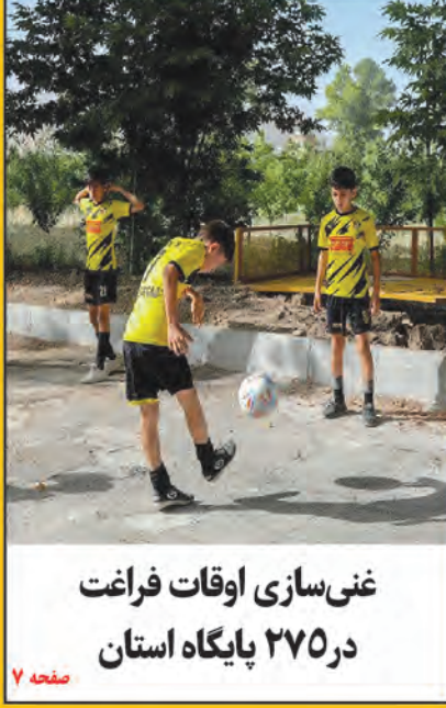
غنی سازی اوقات فراغت در ۲۷۵ پایگاه استان