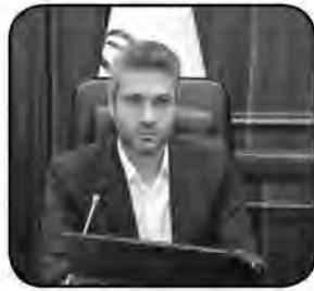
لازم به یادآوری است در چهاردهمین کمیته استانی تبصره ۱۸ استان ۱۱۴ طرح به مبلغ ۱۱ هزار و ۱۰۴ میلیارد ریال مصوب شد.

داد و افزود: دستگاهها پیگیری لازم برای طرح های معرفی شده به بانکها را داشته باشند و بانکها نیز در زمینه پرداخت تسهیلات پیش از پیش اهتمام داشته باشند. وی بیان کرد: تاکنون از محل اعتبارات نقدی ۹ هزار و ۲۰۰ میلیارد ریال و محل اسناد خزانه دو هزار و ۱۴ میلیارد ریال تسهیلات بند الف تبصره ۱۸ به استان تخصیص یافته است. از مجموع ۱۱ هزار و ۲۱۳ میلیارد ریال تسهیلات تخصیصی استان ۸ هزار و ۹۰۰ میلیارد ریال به طرح های مصوب و معرفی شده به