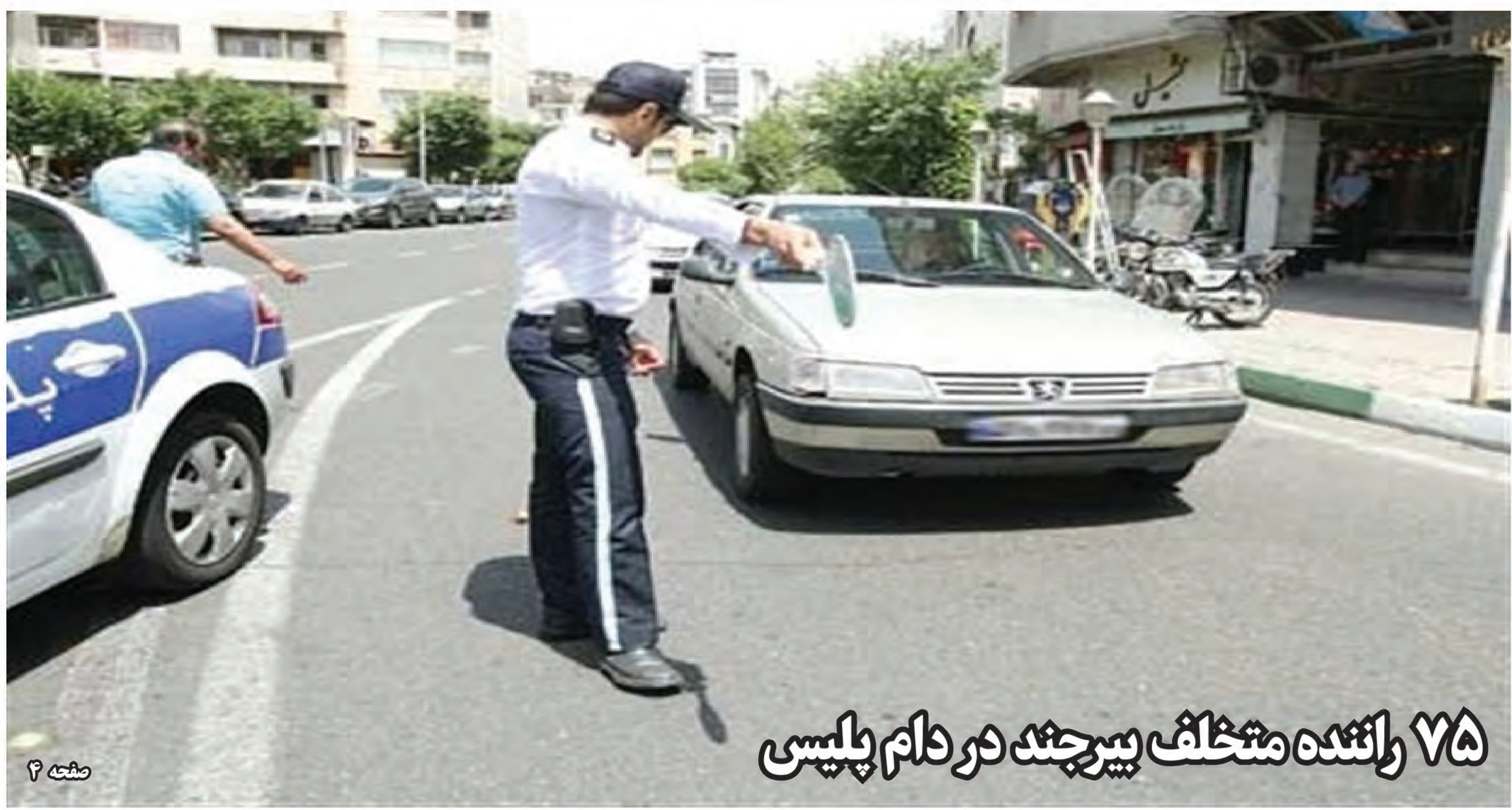
۷۵ راننده متخلف بیرجند در دام پلیسی

وزیر آموزش و پرورش درباره وعده واریز ۴۰ درصد پاداش فرهنگیان بازنشسته تا تیرماه گفت: هر دو هفته یکبار پیگیر پاداش پایان خدمت فرهنگیان هستیم؛ پرداخت سریعتر پاداش حق آنها است اما سال گذشته پاداش در سه قسط انجام شد و امسال هم احتمالاً همین روند انجام خواهد شد. به گزارش ایسنا، رضا مراد صحرایی در جمع خبرنگاران درباره ممنوعیت بازنشستگی معلمان با وجود ۳۰ سال سابقه گفت: طبق قانون مدیریت خدمات کشوری، خدمت افراد با ۶۰ سال سن و ۳۰ سال سابقه و ۶۵ سال سن و ۲۵ سال سابقه با مدرک کارشناسی ارشد اجباری است. وی با بیان اینکه در غیر این حالت، بازنشستگی افراد به نیاز دستگاه بستگی دارد، افزود: ما تا زمانی که نیاز داشته باشیم از حضور همکاران خوب و باکیفیت بهره می‌بریم. وی ادامه داد: بنده پیگیر هستم قبل از آغاز سال تحصیلی بخشی از پاداش معلمان واریز شود. صحرایی گفت: عمده فرهنگیان از مهریه بعد بازنشسته می‌شوند بنابراین پرداخت پاداش را به طور جدی پیگیر می‌کنیم اما تا تأمین اعتبار از سوی سازمان برنامه باید صبر کنیم.