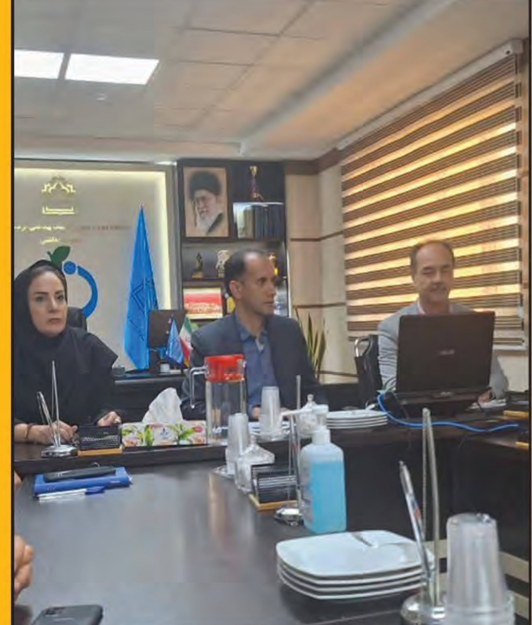
نمونه موارد مشکوک به تب‌دنگی در خراسان جنوبی منفی شد