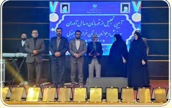
نکرده است. وی اعلام کرد: با لطف دولت سیزدهم به استان‌های کم می‌شود که موفق به کسب مقام‌های کشوری شدند، ادامه

مدیرکل ورزش و جوانان استان خراسان جنوبی همچنین از اجرای طرح آمادگی جسمانی ویژه ورزشکاران حرفه‌ای خبر داد و افزود: در این طرح تحلیل وضعیت آمادگی جسمانی ورزشکاران حرفه‌ای اجرا خواهد شد که به زودی تست‌ها شروع شده و بازخوردها را ارائه می‌دهیم. دکتر ربیعی همچنین به بحث سرمایه‌گذاری در حوزه ورزش اشاره کرد و گفت: همچنین حمایت از ورزشکاران شروع شده که در این زمینه اسپانسر به صورت رسمی حمایت مالی خود را از ورزش ویژه یکی از قهرمانان استان اعلام خواهد کرد. وی همچنین با اشاره به وجود پایگاه قهرمانی در بیرجند افزود این پایگاه طی ۱۵ سال گذشته با دستگاه‌های قبلی کار می‌کند که به لطف وزیر ورزش و جوانان اعتبار خوبی به آن اختصاص یافت که به عنوان پایگاه شرق کشور فعال خواهد شد و در حال حاضر طبقه فوقانی پایگاه قهرمانی برای انجام آزمایش‌های ویژه و مشاوره‌های