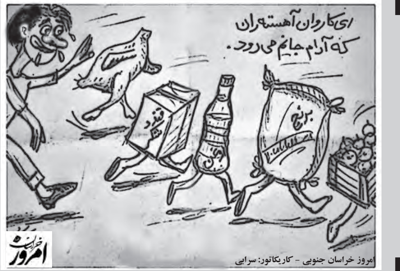
امروز خراسان جنوبی - کاریکاتور: سرایی

به نام خدای حروف و کلمات، به نام خدایی که جهان را به کلمات جان می‌بخشد. به نام قلم، به نام ن‌والقلم وما یسطرون، به نام شهید که هرچه زیبایی است به برکت خون اوست، به نام خبرنگار که در شکوه شهادت صامی عزیز، مقام محمود یافت. به نام محمود که در مزارشرف، شرافت اهل قلم شد. به نام شرافت که از صامی به همه خبرنگاران آزاده و مومن جهان ارث می‌رسد. خبرنگارانی که حق نگارند. اهل حقی که می‌دانند باید با تولید آگاهی، جهالت و نادانی و سیاه روزگاری را نقطه پایان بگذارند. به نام روز خبرنگار که فقط یک رویداد تقویمی نیست بلکه روزی تعلیمی نیز هست. تعلیم مسئولیت‌پذیری اجتماعی، تعلیم حساسیت نسبت به همه رویدادها، تعلیم ایثارگری برای بهتر شدن محیط زیست اجتماعی- فرهنگی و... نیز هست. نقشی چنین می‌طلبید تا قدری چنان برای خبرنگار قابل باشیم که جز بر صدر نشست نمی‌زیبید. خبرنگار امروز در خط مقدم دفاع از هویت ملی است. انقلابی است، مجاهد جهاد تبیین است در سخت‌نگامه‌ای که دشمن با جنگ هیبریدی همه ساحت‌های زندگی را هدف گرفته است. او را باید ستود و حمایت کرد چنان‌که رزمندگان را در جنگ تشویق می‌کنند. مسئولان را باید فراخواند به این مهم تا جبهه آگاهی انقلابی به موفقیت تمام برسد. خانه مطبوعات استان به عنوان نماینده صفی اهالی رسانه ضمن تبریک به هم‌قلمان، مردم و مسئولان را به تعامل سازنده با رسانه دعوت می‌کند. ما در کنار هم فردا را بهتر خواهیم ساخت.