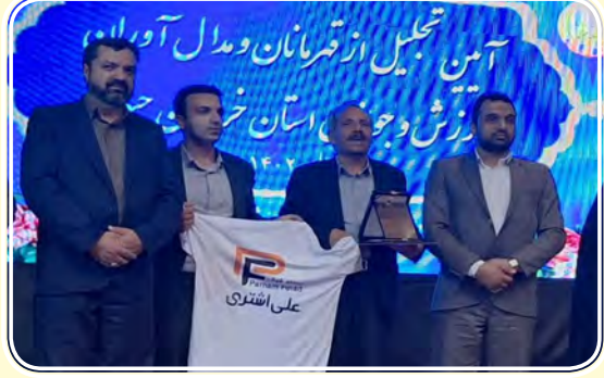
این جلسه ضمن گرامی‌داشت یاد و خاطره ۶۴ شهید ورزشکار مردم استان از ایشان یاد کردند. داشتیم که رهبری در دیدار اخیر مردم استان از ایشان یاد کردند.