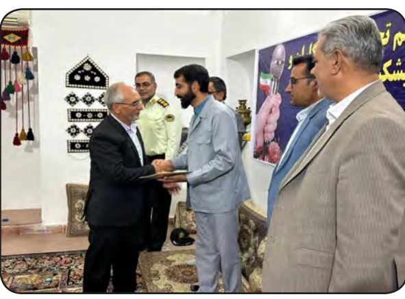
برگزار شده و در حال برگزاری است و تا پایان امسال ۱۰ نفر به جمع خبرنگاران این شهرستان اضافه خواهد شد.