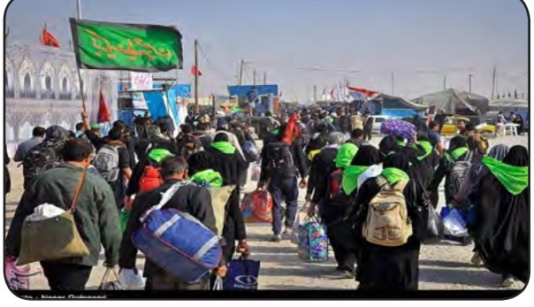
اربعین حسینی (ع) در سامانه سماح از روز سه شنبه ۱۷ تیر ۱۴۰۳ آغاز شده و تا صبح دیرروز یکشنبه ۲۱ مرداد ۳۱ هزار و ۱۱۹ نفر از مردم استان در سامانه