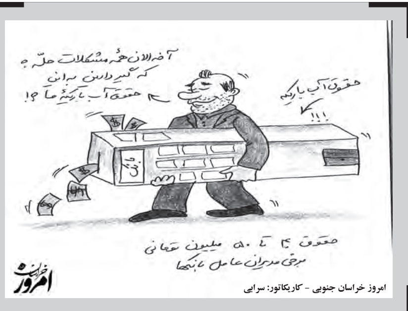
امروز خراسان جنوبی - کاریکاتور: سرای

امروز خراسان جنوبی - امیرحسین حیدری ۶۰۰ زائر اولی با همت بنیاد برکت ستاد اجرایی فرمان امام (ره) در خراسان جنوبی به پیاده روی اربعین حسینی اعزام می شوند. مدیرکل ستاد اجرایی فرمان امام (ره) خراسان جنوبی گفت: بنیاد برکت ستاد اجرایی فرمان امام بنا به رسالت خود در سومین سال پویا پیش برکت الحسین (ع) را در دستور کار خود قرار داده است. موسوی افزود: در این پویا پیش با همکاری و تعامل گروه های مردمی و جهادی ۶۰۰ زائر اولی با ۳ میلیارد تومان اعتبار اعزام مراسم پیاده روی اربعین حسینی می شوند. وی گفت: از این افراد ۱۰۰ نفر زائر اولی آقا واجد شرایط و کم برخوردار دهک یک تا شش هستند که از طریق محلات ۲۰۰ با اعتبار ۶۰۰ میلیون تومان اعزام مراسم پیاده روی اربعین حسینی می شوند. مدیرکل ستاد اجرایی فرمان امام (ره) خراسان جنوبی افزود: همچنین ۱۸۸ نفر زائر اولی کم برخوردار دهک خانوار یک تا پنج که توسط گروه های مردمی و جهادی همکار با ستاد شناسایی شده اند در مناطق محروم استان با کمک هزینه بلاعوض ۳۵ میلیون تومانی اعزام اربعین حسینی میشوند. موسوی افزود: ۲۲۰ فقره تسهیلات قرض الحسنه ۷ میلیون تومانی هم با بازپرداخت یک ساله به افراد واجد شرایط و زائر اولی شناسایی شده توسط گروه های همکار پرداخت می شود. وی گفت: سال گذشته هم ۶۰۰ زائر اولی از خراسان جنوبی در دو قالب پویا پیش سفیر احسان و خانه های احسان ستاد اجرایی فرمان امام (ره) به عتبات عالیات اعزام شدند.