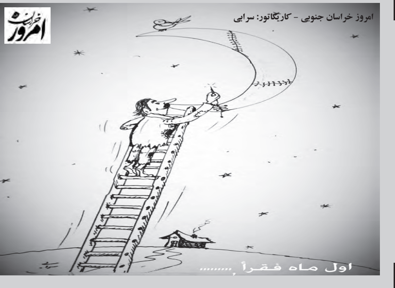
امروز خراسان جنوبی - کاریکاتور: سرایی