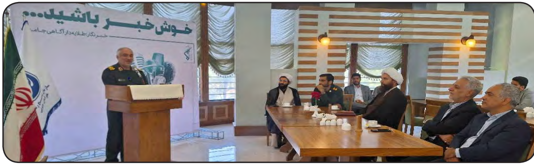
امروز خراسان جنوبی - دهقان