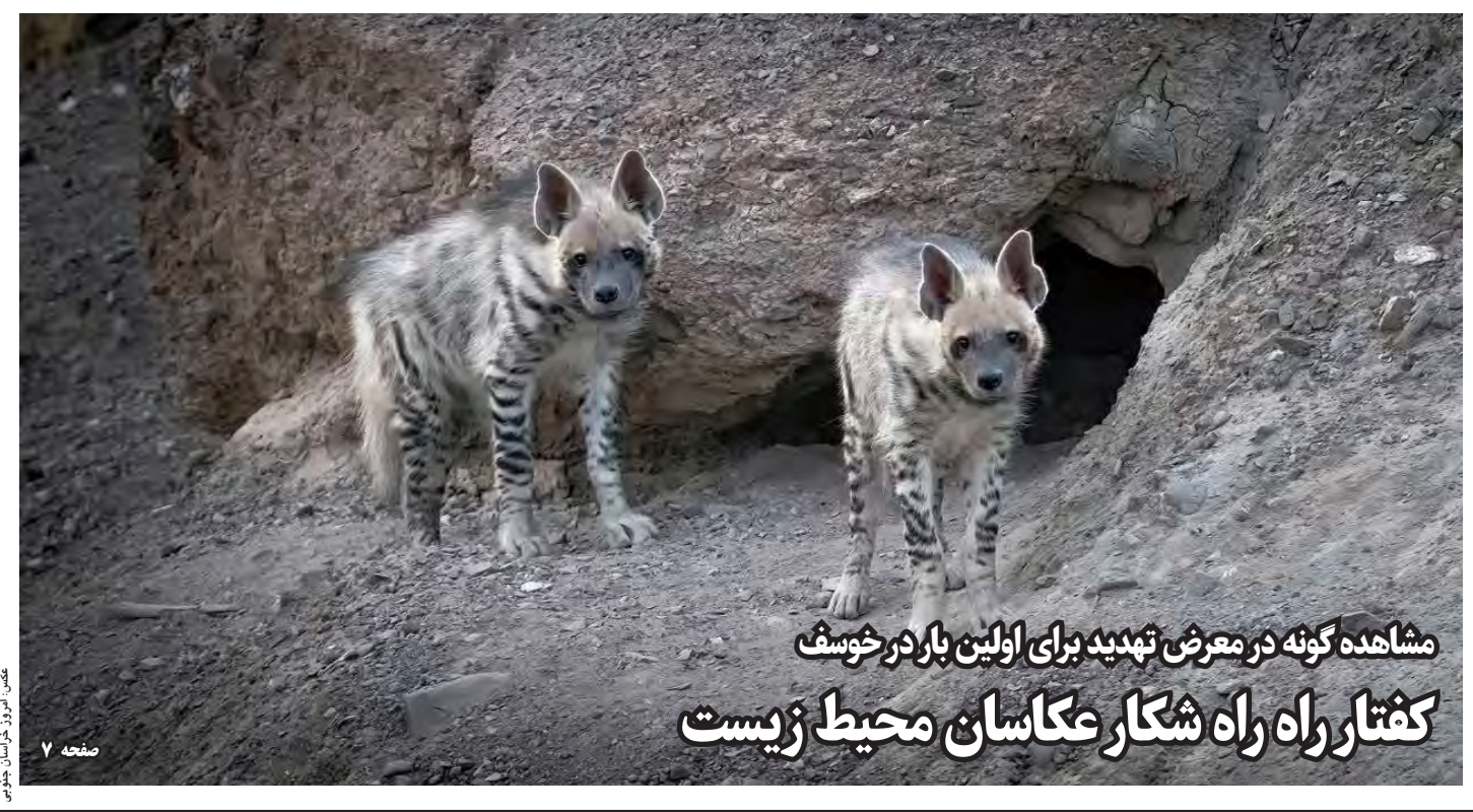
مشاهده گونه در معرض تهدید برای اولین بار در خوشف کفتار راه راه شکار عکاسان محیط زیست

رئیس سازمان مدیریت بحران کشور با بیان اینکه افزایش شدید دما در مردادماه منجر به افزایش ضریب حوادث نیروگاهی و توزیع برق شد، گفت: مردم و مسئولان باید در کنار یکدیگر با اقداماتی از تهدید گرمایش جهانی که در سال های آینده ادامه خواهد داشت، جلوگیری کنند. به گزارش خبرنگاری صدا و سیما، محمد حسن نامی با اشاره به اینکه تابستان امسال متاثر از پدیده تغییر اقلیم و روند گرمایش جهانی است، افزود: در مردادماه سال جاری و تنها در تهران ۱۱ بار دمای بالای ۴۰ درجه به ثبت رسید که در تاریخ بی سابقه بوده است. وی با بیان اینکه سازمان های بین المللی هواشناسی ماه جاری میلادی را گرم ترین ماه تاریخ اعلام کرد، گفت: استقرار گنبد حرارتی در منطقه غرب آسیا و به ویژه ایران، افزایش دمای هوا در مناطق مختلف کشور را تشدید کرد. وی با اشاره به اینکه در تابستان سال جاری، به صورت پیوسته تعداد قابل توجهی از شهرهای ایران در فهرست گرم ترین شهرهای جهان قرار گرفتند، افزود: پانزدهم ماه اوت سه شهر طیس، امیدیه و دزفول ایران به عنوان گرم ترین شهرهای جهان معرفی شدند و این سه شهر در کنار سه شهر دیگر زابل، اهواز و آبادان در فهرست ۱۵ شهر گرم جهان قرار گرفتند.