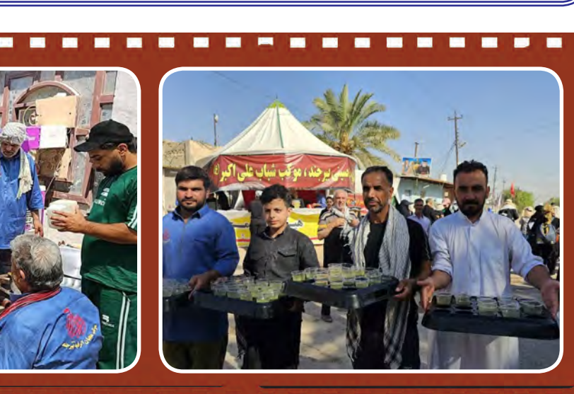
روایت عشق و دلدادگی در موبک محبان الرقیبه (س) بیرجند در جوار مسجد سهله عمود ۹۲