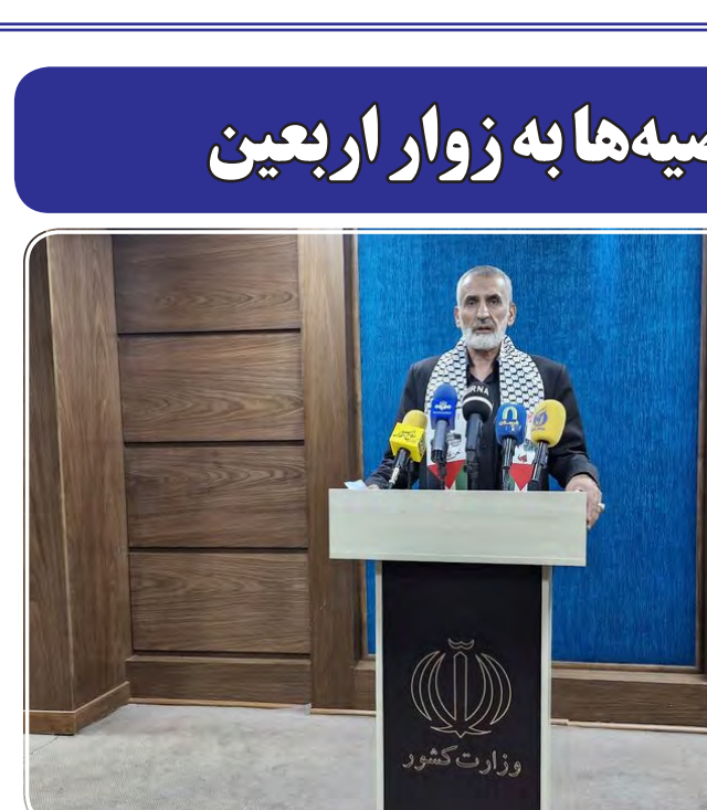
بعد از ۲ روز مرزا به شرایط معمول قبل بازمی‌گردد.

آخرین توصیه‌ها به زوار اربعین شده که ۲۴ ساعته و شبانه روزی مسائل مطرح و مشکلات احتمالی رفع می‌شود. برای یک بازگشت زائران مشکلی نداریم وی با اشاره به پیک بازگشت زائران اظهار کرد: برای بازگشت زائران و گزارش کمیته حمل و نقل هیچ نگرانی نداریم و سازو کار نظارت بر قیمت بلیط هواپیما قرار گرفته است و اگر اضافه قیمت برداشت شود هزینه از حساب اپرین‌ها برداشته می‌شود به حساب زائران باز می‌گردد. وی ادامه داد: قریب به ۷۰ درصد زائران از خودروی شخصی استفاده کردند و قریب به دو میلیون و ۲۰۰ هزار نفر از مرز عبور کردند زائران پاکستانی نیز با نظم خوبی در حال عبور هستند. وی به زوار ایرانی توصیه کرد: زائرانی که می‌خواهند عازم شوند سفر خود را به روزهای آخر مکتول نکنند و مدت ماندگاری در کربلا را کمتر از یک روز قرار دهند عراقی‌ها در روز اربعین تمام موبک‌های خود را جمع‌آوری می‌کنند و قبل از روز اربعین اگر پیش‌بینی شخصی ندارند به کشور بازگردند و دو روز بعد از اربعین خدمات مرزی نیز در مرز ایران و عراق وجود دارد و بازمی‌گردد. کاهش ۳۰۰ درصدی فوتی‌های اربعین نسبت به سال قبل وی در مورد فوتی‌ها تصریح کرد: تا کنون ۹ نفر فوتی گزارش شده است، میزان فوتی ها، ۳۰۰ درصد کاهش نسبت به سال گذشته داشتیم و در مورد گرمادگی نیز نگرانی نداریم. میراحمدی اظهار کرد: خدمات بهداشتی و درمان ۱۰۰ درصد نسبت به سال گذشته افزایش داشته است مشکل حمل و نقل در داخل عراق از نظر کمبود وسایل نقلیه و گرانی قیمت وجود نداشته است، امسال