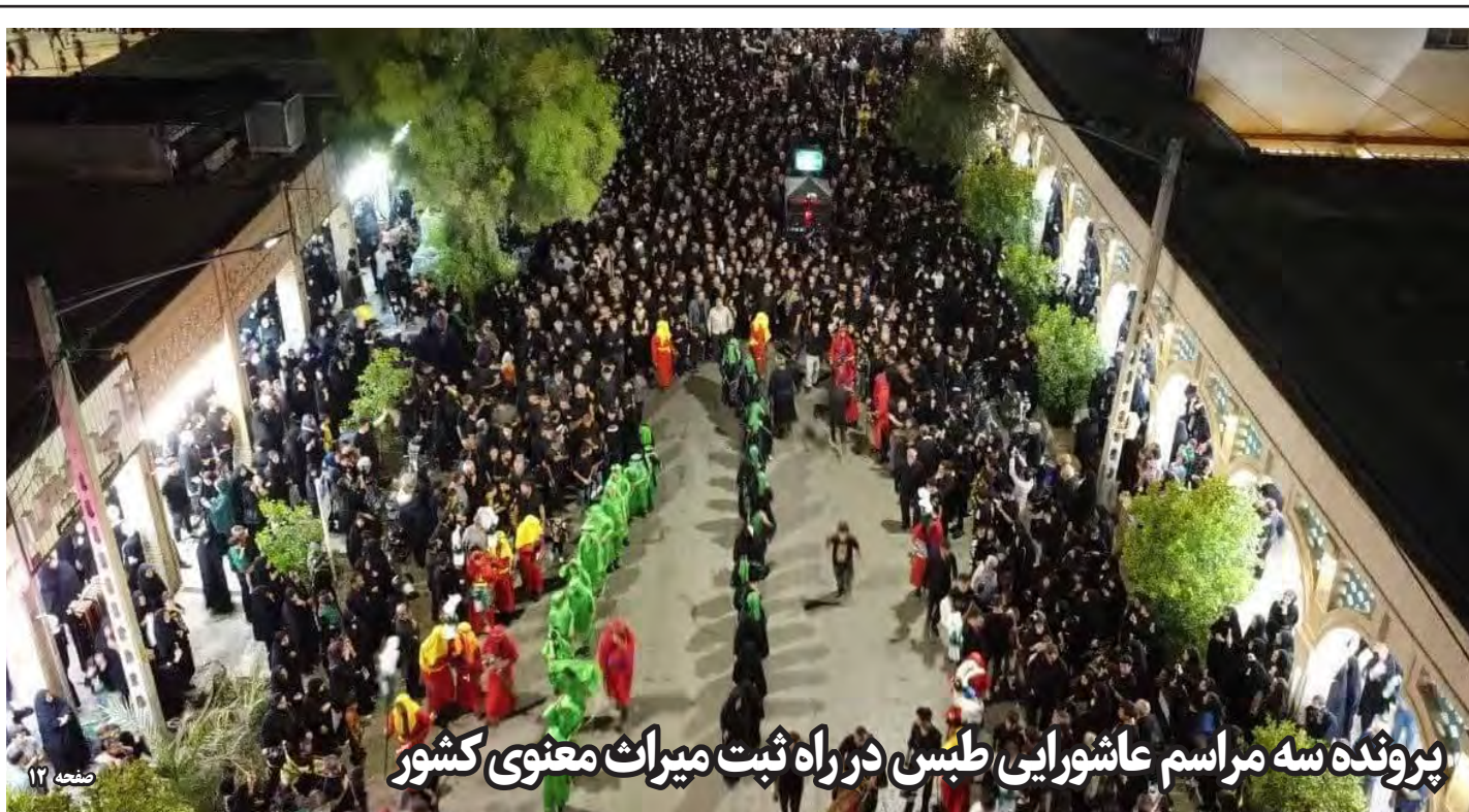
پرونده سه مراسم عاشورایی طوسی در راه ثبت میراث معنوی کشور