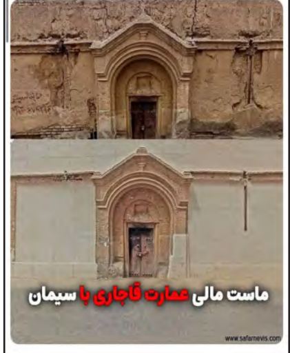
ماست مالی عمارت قاجاری را سیمان