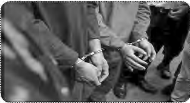
عملیات ضربتی دستگیر و تعدادی اموال مسروقه کشف کردند. رئیس پلیس آگاهی خراسان جنوبی