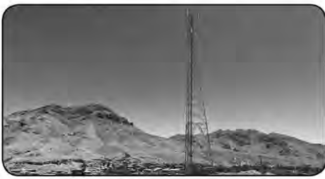
ملی اطلاعات متصل شدند. وی عنوان کرد: این پروژه‌ها با اعتبار بیش از ۳۸۵ میلیارد ریال از محل منابع طرح توسعه ارتباطات روستایی وزارت ارتباطات و فناوری اطلاعات اجرا شده است. بهی افزود: با اجرای این طرح‌ها بیش از هزار خانوار روستایی استان از خدمات اینترنتی بر شبکه ملی اطلاعات و اینترنت

مدیرکل ارتباطات و فناوری اطلاعات خراسان جنوبی از ابلاغ اجرای شبکه ملی اطلاعات در ۱۴۴ روستای باقی مانده است که تا پایان سال جاری این روستاها هم به شبکه ملی اطلاعات متصل می‌شوند. مدیرکل ارتباطات و فناوری اطلاعات خراسان جنوبی از راه اندازی ۹ سایت توسعه شبکه ملی اطلاعات استان در یک ماه گذشته خبر داد و گفت: با اجرا و توسعه این سایت‌ها ۱۱ روستا به شبکه