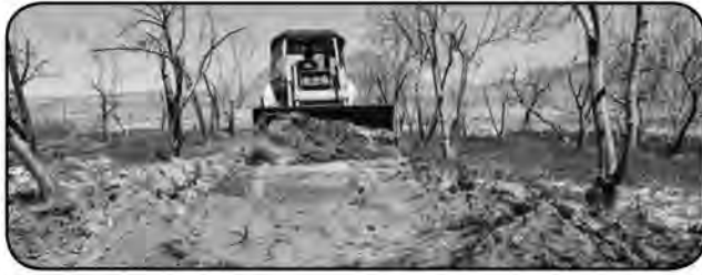
احکام صادر شده از مراجع قضایی مبنی بر پر کردن چاه‌های غیر مجاز در استان.