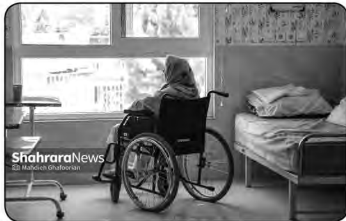
سازي را دنبال كنيم.

راه‌اندازی آن باید سرعت گیرد. وی با اشاره به لزوم تخصیص ۱۰۰ درصدی اعتبار طرح تجهیز کلینیک‌های تخصصی دوستاندار سالمند افزود: شهرداری بیرجند با برنامه‌های مناسب شهر دوستاندار سالمند، طرح‌هایی را در هفته سالمندان اجرایی کند. معاون استاندار خراسان جنوبی با تأکید بر لزوم مناسب سازی مراکز روزانه نگهداری می‌شوند.