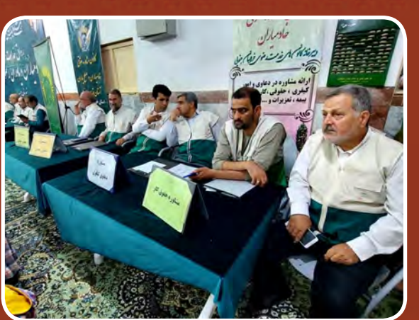
رواق خدمت خادمان و باوران رضوی شهرستان بیرجند به مناسبت هفته دفاع مقدس و میز خدمت کانون های تخصصی در حسینیه روستای مرک