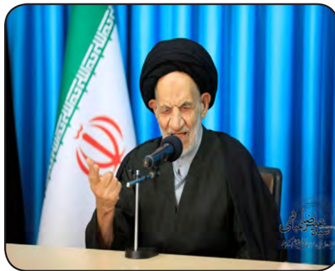
مرور خراسان جنوبی - گروه خبر

مردم شب می خواهند و نگران گرانی فردا هستند، مگر کشور صاحب ندارد؟ نماینده ولی فقیه در خراسان جنوبی و امام جمعه بیرجند این سوال را در جلسه دیدار دادستان کل کشور مطرح کرد و گفت: مردم از گرانی برخی اجناس خسته و گلایه مند هستند؛ برخی از کالاهای اساسی از جمله نان گران می‌شود در صورتی که گرانی فقط پول ملی را بی ارزش می‌کند و سودی ندارد. حجت الاسلام و المسلمین سید علیرضا عبادی با بیان اینکه گرانی تنها ضرر برای جامعه است بویژه اگر چند نوبت