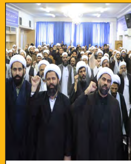
شهادت سید حسن نصرالله... برای استکبار گران تمام خواهد شد صفحه ۵

افتخار آفرینی بانوی فردوسی حافظ قرآن صفحه ۲