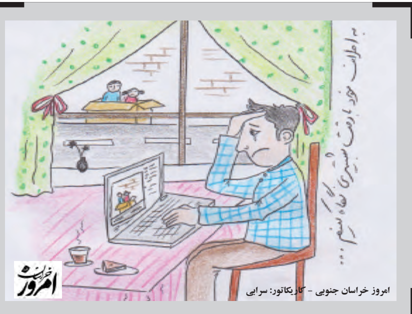
امروز خراسان جنوبی