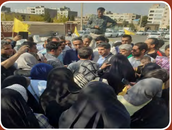
تجمع بیرجندی ها در اعتراض به مسکن ملی در اراضی زعفرانیه