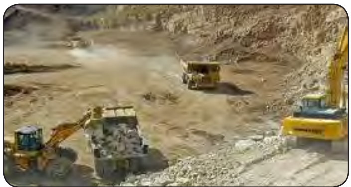
با بهره برداری از پروانه های بهره‌برداری جدید در خراسان جنوبی ۳۹۸ میلیارد تومانی سرمایه‌گذاری شده است.