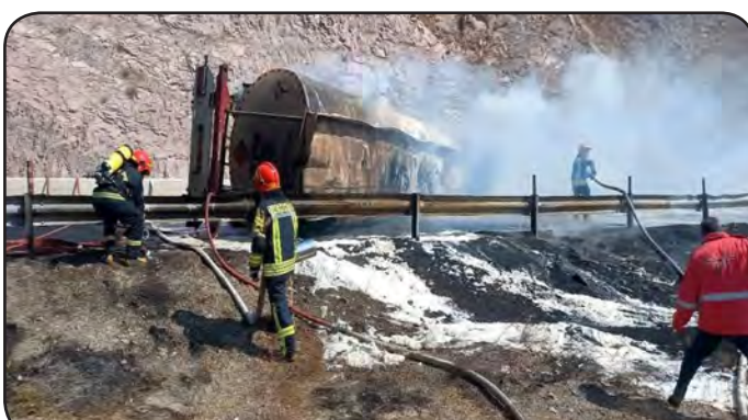
رضایی افزود: بنا بر بررسی انجام شده یک دستگاه تریلی تانکر فوتون با بار روغن پایه

به همراه مأموران انتظامی، پلیس راه و نیروهای امدادی در محل حادثه حاضر شدیم. سرهنگ