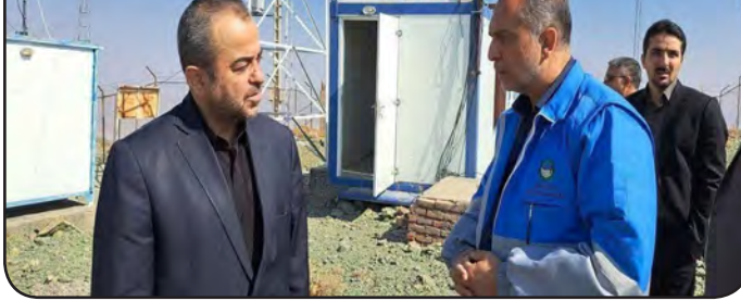
لرزه نگاری بیرجند ارسال می شود تا در این مرکز مورد پایش و تحلیل قرار گیرد. وی با بیان اینکه اطلاعات ارائه شده

مدیرکل مدیریت بحران استانداری خراسان جنوبی گفت: با توجه به لرزه خیزی استان، ۱۱ ایستگاه لرزه نگاری در ارتفاعات این استان مستقر شده است.