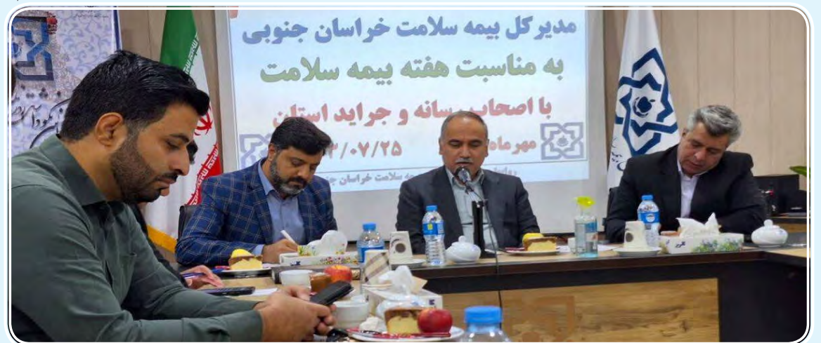
مدیر کل بیمه سلامت خراسان جنوبی به مناسبت هفته بیمه سلامت با اصحاب رسانه و جراید استان

امروز خراسان جنوبی - حمیدی ۴۸۵ هزار نفر در قالب ۶۳ درصد جمعیت استان خراسان جنوبی تحت پوشش بیمه سلامت هستند و از خدمات این مجموعه استفاده می کنند. مدیرکل بیمه سلامت خراسان جنوبی با بیان این خبر همزمان با فرارسیدن هفته بیمه سلامت از ۲۸ مهرماه تا ۴ آبان ماه در جمع خبرنگاران عنوان کرد: هدف بیمه سلامت این است که هیچ ایرانی فاقد بیمه نباشد و از طرفی بیمه سلامت تلاش دارد در مقابل ریسک هایی مثل بیماری برای بیمه شده جبران خسارت کند.