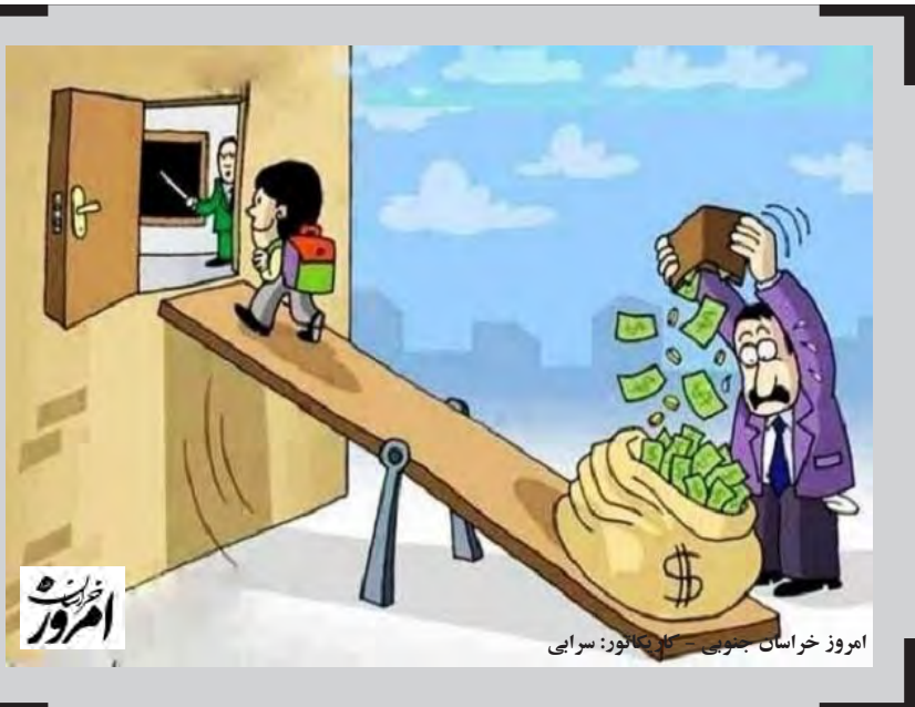
امروز خراسان جنوبی - کارتون: سراجی