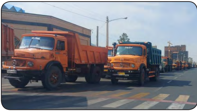
قابل قبول است و پیمایشی برایشان محسوب نمی شود، سوخت به آنها تعلق نمی گیرد. بنابراین در چنین شرایطی که تنها امید کمپرسی داران سوخت آزاد است، شاهد حذف کارت های سوخت آزاد از جایگاهها هستیم. موضوعی که باعث شد جمعی از این صنف جلوی استانداری تجمع و خواستار پیگیری آن شوند.