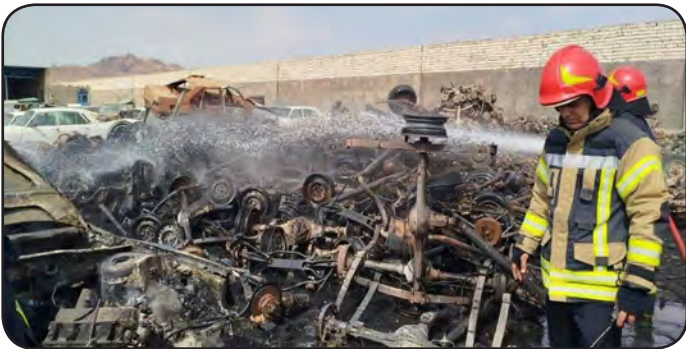
رسید و خسارت جانی نداشت رئیس سازمان آتش نشانی و خدمات ایمنی شهرداری بیرجند با اشاره به اینکه علت اصلی حادثه در دست بررسی است ادامه داد: قبل از این هم در این مکان ۲ مورد آتش سوزی رخ داده که بیشتر منشاء آتش، استفاده از دستگاه برش و جوش برای اسقاط خودروها است.