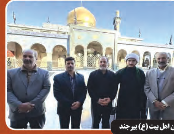
دمشق؛ میزبان موبک بر جمداران اهل بیت (ع) بیرجند