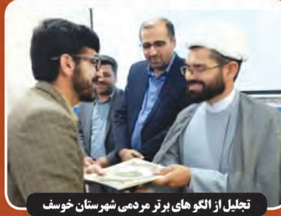
تجلیل از الگوهای برتر مردمی شهرستان خوسف