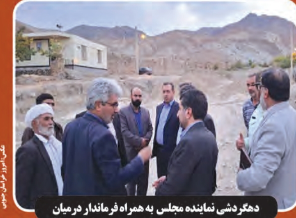
دهکر دشی نماینده مجلس به همراه فرماندار در میان

وزیر امور خارجه با بیان اینکه در سفر به مصر با برخی همراهان به رستورانی در قاهره رفته است، گفت: جای یک رستوران مصری در تهران خالی است. سید عباس عراقچی در صفحه شخصی خود در شبکه اجتماعی ایکس اظهار داشت: در سفر به مصر به اتفاق همراهان به رستوران مردمی ابوطارک در وسط شهر قاهره رفتیم و غذای مشهور مصری کشری خوردیم.