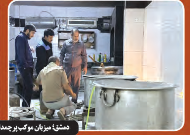
دمشق؛ میزبان موبک بر جمداران اهل بیت (ع) بیرجند