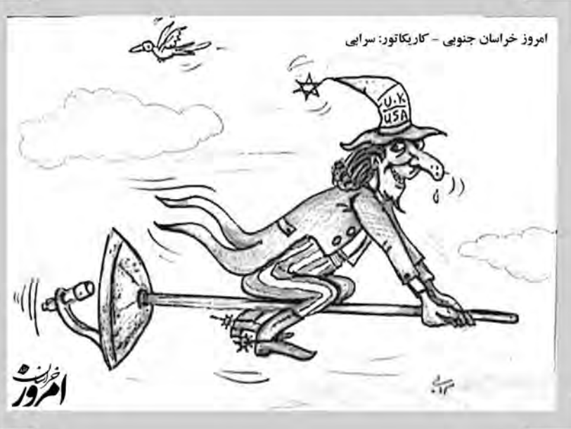
امروز خراسان جنوبی