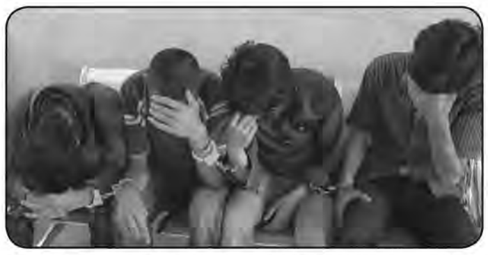
نوبین کشف جرم، ۲ سارق و ۲ مالخرا شناسایی و پس از هماهنگی با مقام قضایی متهمان را در

امروز خراسان جنوبی-صادقی متهمان بازداشت شده پس از سرقت انجام شده از عمارت تاریخی شوکت‌آباد بیرجند به جرم خود اعتراف کردند. رئیس پلیس آگاهی خراسان جنوبی گفت: چهار سارق و مالخرا در پی سرقت از مجتمع گردشگری عمارت تاریخی شوکت‌آباد بیرجند دستگیر و اموال مسروقه کشف شد. سرهنگ کاظم صادقی افزود: با وقوع یک فقره سرقت در مجتمع گردشگری و باغ و عمارت تاریخی شوکت‌آباد شهرستان بیرجند بررسی موضوع و دستگیری سارق یا سارقان در دستور کار آگاهان پلیس آگاهی استان قرار گرفت. وی افزود: کارآگاهان پلیس آگاهی استان با انجام اقدامات اطلاعاتی و روش‌های علمی و