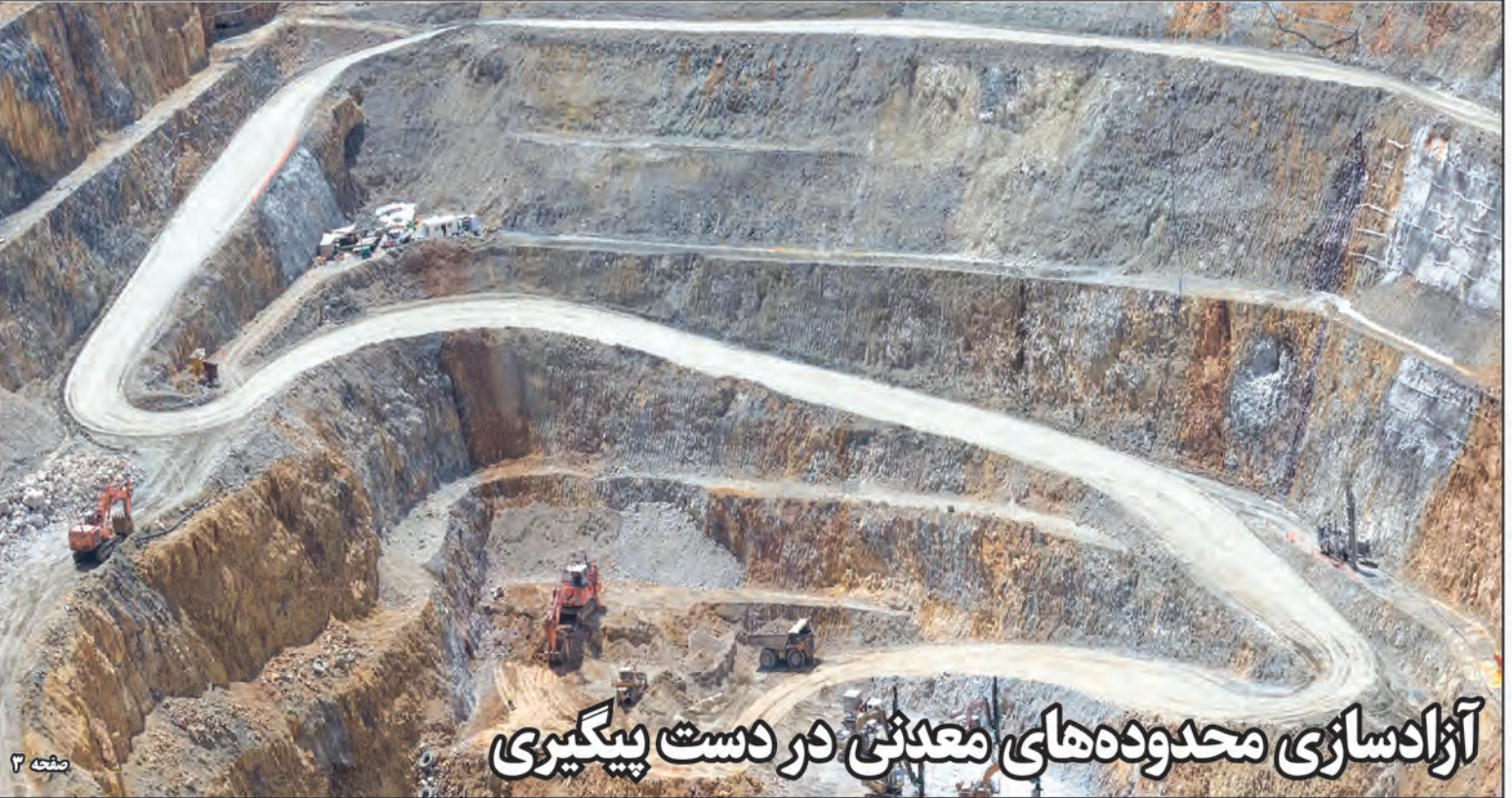
آزادسازی محدوده‌های معدنی در دست پیگیری