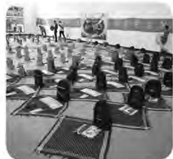
توزیع بسته‌های حمایتی به دانش آموزان

شده است. وی ادامه داد: توزیع بسته‌ها توسط گروه‌های جهادی و مربیان طرح‌های تربیتی همزمان با هفته بسیج دانش آموزی بین دانش‌آموزان نیازمند انجام می‌شود. موسوی زاهد گفت: همچنین به مناسبت هفته بسیج دانش‌آموزی، واحد مقاومت بسیج در مدرسه دخترانه امام حسین (ع) بیرجند افتتاح و پویش جفیه‌های بهشتی در آنجا اجرا شد. هشتم تا ۱۳ آبان ماه هفته بسیج دانش‌آموزی نامگذاری شده است.