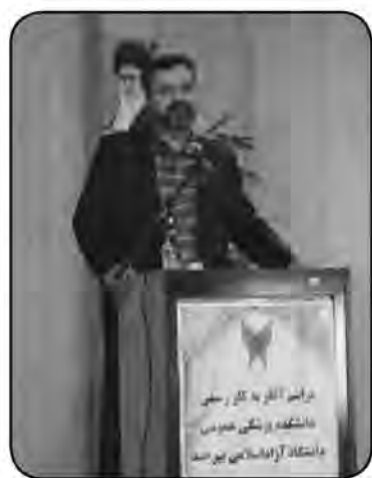
امروز خراسان جنوبی - حمیدی با حضور معاون سیاسی، امنیتی و اجتماعی استانداری خراسان جنوبی، رئیس دانشگاه آزاد اسلامی، رئیس دانشگاه علوم پزشکی بیرجند و جمعی از مسئولین، اساتید و دانشجویان طی مراسمی دانشکده پزشکی عمومی دانشگاه آزاد اسلامی واحد بیرجند آغاز یکبار کرد.