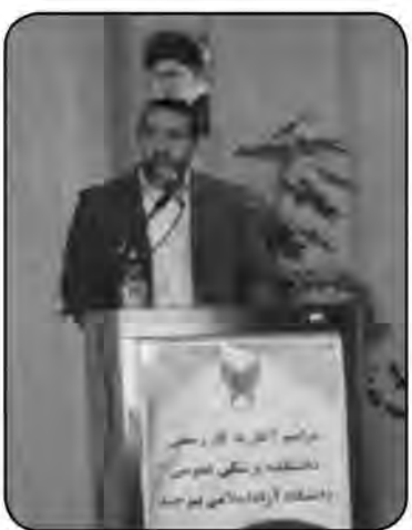
بیمارستان های زیرمجموعه، بیمارستان تأمین اجتماعی و دانشگاه آزاد استان قابل قدرندانی است چون اگر این همگرای، همپوشانی و همکاری‌ها نبود قطع به یقین این اتفاق مبارک رقم نمی‌خورد.

وی با اشاره به دانشکده پزشکی عمومی دانشگاه آزاد بیرجند افزود: مجوز این دانشکده با تلاش و پیگیری های فراوان رؤسای این دانشگاه از سال‌های گذشته تاکنون اخذ شد و برای تأمین تجهیزات و امکانات استاندارد نیز باید تلاش شود. به گفته وی: جلسات فراوان استاندار با تیم های ارزیاب وزارت بهداشت و... حمایت های ویژه ای که از این موضوع صورت گرفت، روند اجرای کار و راه اندازی رشته های پزشکی در این دانشگاه سرعت بخشید. طالبی بیان کرد: تعامل، همراهی و همکاری بسیار خوب بین دانشگاه علوم پزشکی و