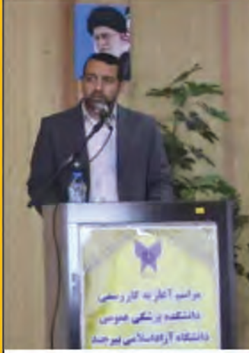
مراسم آغاز به کار رسمی دانشکده پزشکی عمومی دانشگاه آزاد اسلامی واحد بیرجند برگزار شد صفحه ۵

بیرجند، روبروی بیمارستان امام رضا (ع) - خیابان مفتح - ساختمان خیام