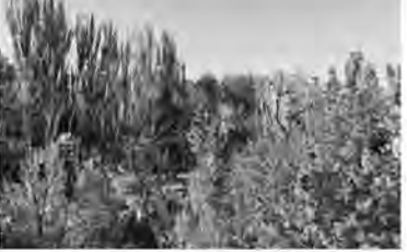
امروز خراسان جنوبی - محمدحسین اشرف زاده خراسان جنوبی هم مانند دیگر نقاط کشور ایران سرزمینی چهار فصل است که به مدد وجود کوهستان های زیبا، کویر بکر و شگفت انگیز و طبیعتی سحرانگیز توانسته است لفظاتی خاص، مفرح و خاطره انگیز را برای هم استانی ها و گردشگران رقم بزند که یکی از این جاذبه های گردشگری در محدوده شهرستان درمیان قرار گرفته است. کافیبست از شهر بیرجند عزم سفر بکنید ۶۵ کیلومتر پیمودن راه و گذر از مجاورت شهر قیستان و در نهایت به تماشای نشستن شاهکار خلقت در دل کوهستان و رسیدن به سرزمینی بیلاقی با مراتعی سرسبز همراه با طبیعتی بکر و خشک که آن را سرخنگ نام نهاده اند. سرخنگ نمونه ای از شگفتی آفرینش است. روستایی سرسبز و باطراوت با چندین رشته قنات در دل کویر که علاوه بر همه این جاذبه ها از آشپاری زیبا و چناری ۵۰ساله نیز بهره می برد. این روستا از روستاهای هدف گردشگری استان خراسان جنوبی است که در فصول مختلف سال میزبان گردشگران و مسافران از شهرها حتی استان های مجاور است، همان هایی که آمده اند لغتی در زیر سایه سار درختان گردو، زردآلو، بادام، سیب‌درد و چنار بیاسایند و خاطراتی بیاد ماندنی را ثبت کنند البته در این وقت سال شیفته زیبایی درختان سرخ رنگ زرشک هم می شوند که بی نهایت دلبری می کند. این روستا با باغستان های انبوه و خانه های قدیمی و کاهگلی در حصار کوه ها قرار گرفته و در فصل بهار دامن سبز و طبیعت بکرش چشم نواز است و در پاییز چهره رنگارنگ آن، هر چند که از صفای تابستان و چشم انداز زمستان این منطقه از استان هم نمی شود به راحتی گذشت. با محمد اشرفی دهیار روستا دقایقی هم کلام شدیم. وی ضمن اشاره به بن بست بودن روستا اظهار داشت: همین امر سبب شده تردد خودروها در روستا به سختی و کندی صورت پذیرد که پیشنهاد می شود مسئولان هرچه سریعتر برای احداث پارکینگ عمومی اقدام کنند و در حال حاضر بهتر است گردشگران در همان ورودی روستا توقف کنند و قدم زنان کوچه پس کوچه های روستا را طی کنند البته مراقب باغ ها و محصول اهالی هم باشند. مردم سرخنگ با پیشینه فرهنگی بالایی که دارند حرمت مهمان را وظیفه خود می دانند و در نقطه مقابل انتظار دارند گردشگران نیز سبب سلب آسایش عمومی نشوند. اشرفی یکی از بزرگترین موانع گردشگری روستا را نداشتن فضای عمومی برای استراحت مردم دانست و از تدبیر نداشتن مدیران محلی و استانی وقت در راستای جانمایی کارشناسی نشده، نبود نظارت، مدیریت و همچنین رعاشنگی مجتمع نیمه تمام گردشگری حفافصل قیستان و سرخنگ گلایه کرد. وی در پایان گفت: البته دهیاری مصمم به احداث سوئیت و سرویس بهداشتی عمومی برای رفاه خانواده ها و گردشگران است که باز هم مثل همیشه مساعدت استانداری و مجموعه میراث فرهنگی استان را می طلبد.

دکتر عزیزی با اشاره به تلاش هایی که دکتر