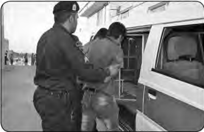
فرمانده انتظامی شهرستان فردوس از دستگیری ۲ ضارب آمر به معروف در کمتر از ۲۴ ساعت در این شهرستان خبر داد.