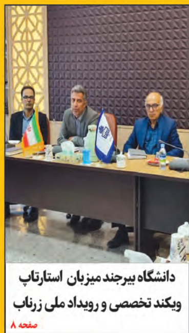
دانشگاه بیرجند میزبان استارتاپ و یکنند تخصصی و رویداد ملی زرناب صفحه ۸

۲۷/۶ میلیارد برای کتابخانه ها مصوب شد صفحه ۲