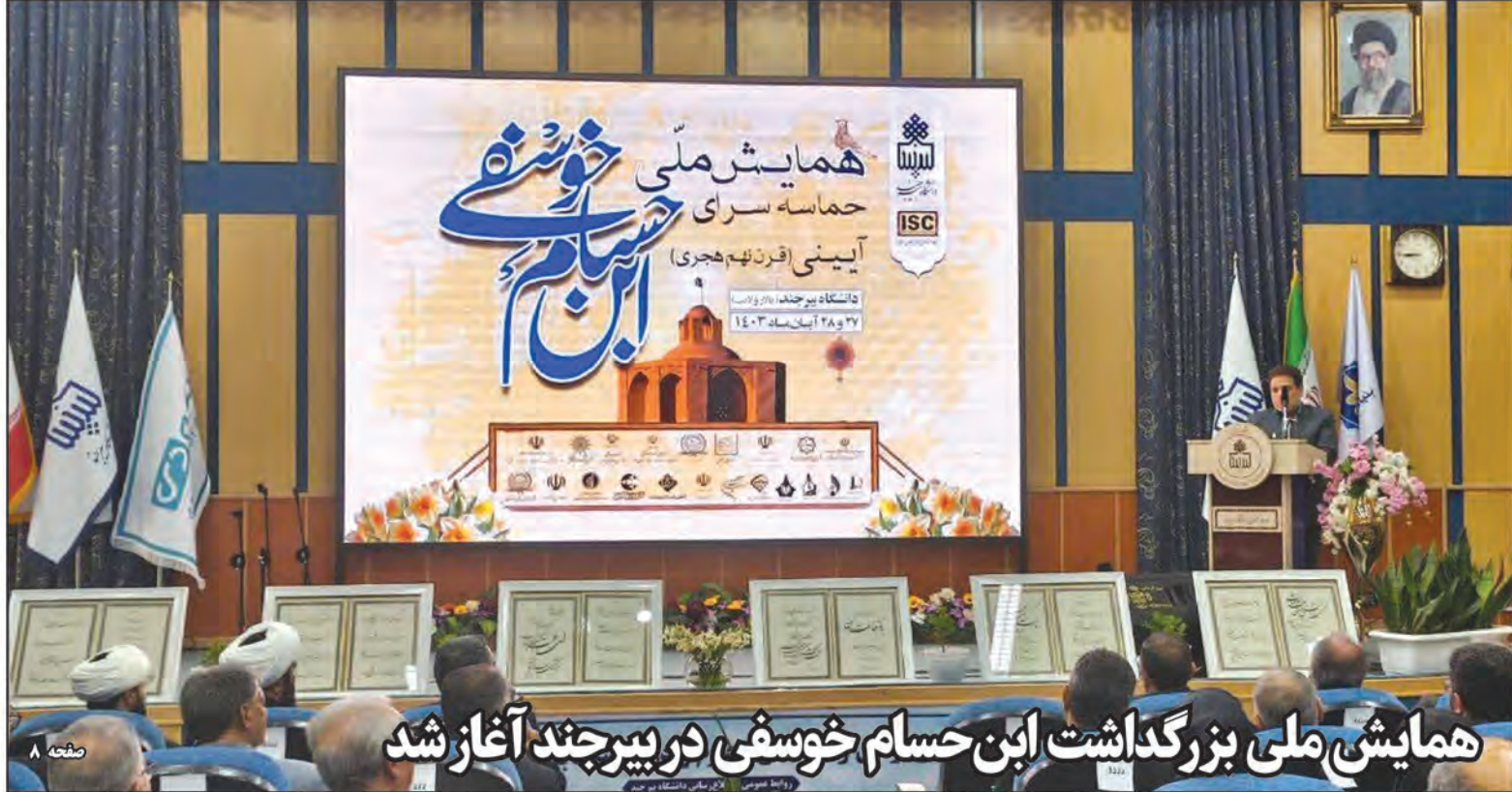
همایش ملی بزرگداشت ابن حسام خوشفی در بیرجند آغاز شد

آخرین داده‌های آماری بانک مرکزی نشان می‌دهد برای صنایع حمل و نقل و خودرو با ارزش نیمی، معادل سه میلیارد و ۷۸۲ میلیون دلار اختصاص داده شده که بیشترین سهم دریافت ارز را بین صنایع دیگر به خود اختصاص داده است. صنایع حمل‌ونقل خودرو از ابتدای امسال تا ۲۱ آبان ماه سال جاری در مجموع (با تأمین ارز نیما و واردات در برابر صادرات) میزان پنج میلیارد و ۹۴۲ میلیون دلار ارز دریافت کرده‌اند. به گزارش «تابناک»، با وجود اینکه ارز دولتی زیادی صرف شرکت‌های خودروسازان داخلی شده است، اما در عمل نتیجه‌ای جز زیان انباشته در صورت‌های مالی و کاهش میزان تولید نداشته است. این در حالی است که سال‌هاست این دو خودروساز بزرگ کشور (ایران خودرو و سایپا) محصولات خود را به اسم تولید ملی با قیمت ارزی به مردم می‌فروشد و هر زمان که قیمت ارز افزایش پیدا کرده است به بهانه تحریم و افزایش نرخ دلار، قیمت محصولات خود را نیز افزایش داده اند.