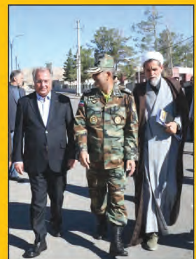
عملیات اجرایی بازگشایی خیابان معلم بیرجند آغاز شد صفحه ۸