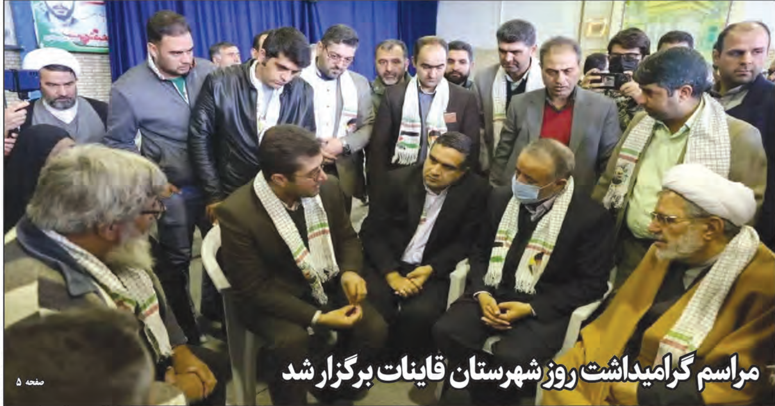
مراسم گرامیداشت روز شهرستان قاینات برگزار شد

آن دسته از مشمولان سهام عدالت که سود سهام سال مالی ۱۳۹۹ را دریافت نکرده اند، باید نسبت به درج و ثبت شماره شبای معتبر بانکی در سامانه سجام یا سایت سهام عدالت اقدام کنند. شرکت سپرده گذاری مرکزی برای جاماندگان از سهام عدالت اطلاعیه ای صادر کرد. در این اطلاعیه آمده است: به اطلاع آن دسته از مشمولان سهام عدالت که سود سهام سال مالی ۱۳۹۹ را دریافت نکرده است، می رساند این گونه مشمولان باید نسبت به درج و ثبت شماره شبای معتبر بانکی در سامانه سجام یا سایت سهام عدالت اقدام کنند تا سود سهام عدالت برای این دسته از مشمولان واریز شود. در ادامه این اطلاعیه آمده است که علاوه بر شماره شبای نامعتبر، حساب بانکی مسدود، راکد، مشترک (دو امضا)، ارز و بلندمدت، از مهم ترین دلایلی است که باعث شد تا سود سهامداران به حساب آن ها واریز نشود. بر این اساس مشمولین سهام عدالتی که یکی از دلایل فوق شامل آن ها می شود می بایست نسبت به رفع و اصلاح این مغایرت ها اقدامات لازم را انجام دهند تا در مراحل آتی سود سهام عدالت به حساب این افراد واریز شود.