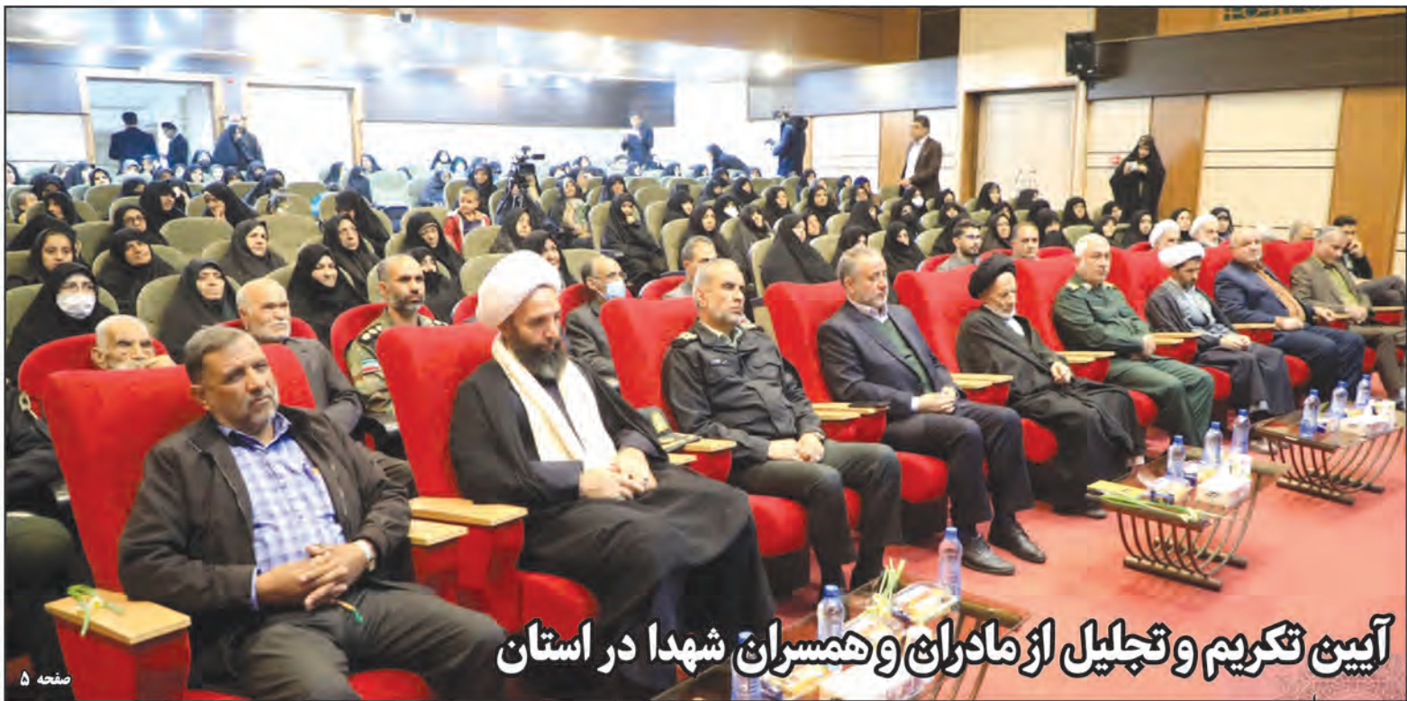
آیین تکریم و تجلیل از مادران و همسران شهدا در استان