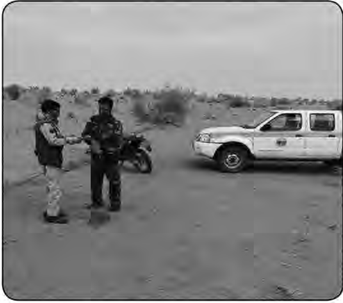
رها سازی شده اند.

وی با اشاره به اینکه شکارچیان بومی خریداران غیر بومی از شهرهای حاشیه خلیج فارس هستند ادامه داد: هوبره ها از طریق کانتینرهایی که از مرز دوغارون و معدن سنگان خواب به بنادر کشور می روند جاساز شده و هر هوبره ۵۰ تا ۱۰۰ میلیون ریال قیمت دارد اما وقتی به دست اعراب می رسد قیمت آن به یک میلیارد ریال هم می رسد. رئیس نمایندگی حفاظت محیط زیست شهرستان زیرکوه یادآور شد: از ابتدای سال حدود ۳۷ قطعه هوبره کشف و در مناطق امن و زیستگاه هایی که محیط بانان اشراف بیشتری دارند