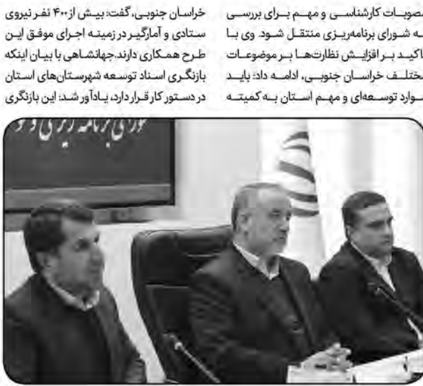
برنامه ریزی منتقل شود. از شهرستان عشق آباد شروع کردیم و در بقیه شهرستان ها هم پس از اعلام برش استانی برنامه هفته توسعه شروع خواهد شد.