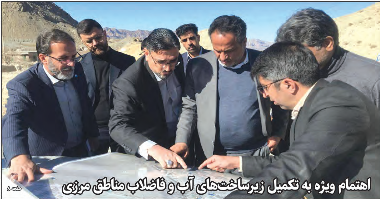
اهتمام ویژه به تکمیل زیرساخت های آب و فاضلاب مناطق مرزی