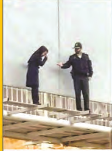
نجات از خودکشی در بیرجند