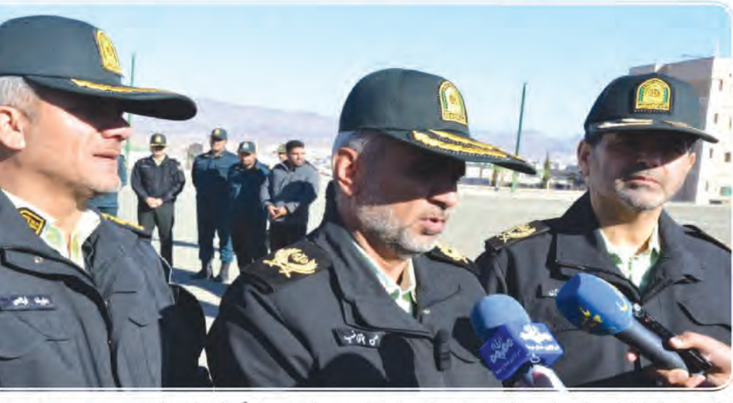
قدرت نه گفتن را به فرزندانمان بیاموزیم

فرمانده انتظامی استان خراسان جنوبی از کشف ۴۸۰ کیلوگرم تریاک در شهرستان قاینات در راستای مقابله و مبارزه با سوداگران مرگ و قاچاقچیان مواد مخدر در بازرسی از یک خودرو خبر داد. سردار حسن شجاعی نسب در جمع خبرنگاران و در حاشیه بازدید از این محموله کشف شده که با حضور جانشین پلیس مبارزه با مواد مخدر فراجا انجام گرفت، افزود: همکاران انتظامی استان و رزمندگان فرمانده انتظامی استان خراسان جنوبی در پلیس مبارزه با مخدر هنگام کنترل خودروهای محورهای مواصلاتی به یک دستگاه خودروی فونیکس مشکوک شدند و خودرو را با اقدامات پلیسی متوقف کردند. وی عنوان کرد: همچنین از ابتدای سال ۹۹ درصد افزایش برخورد و دستگیری خرده فروشان موادمخدر را داشته ایم تا امنیت و آرامش را به جامعه برگردانیم. تکیه بر شرکت‌های دانش بنیان برای تهیه امکانات کشف مواد مخدر جانشین پلیس مبارزه با موادمخدر فراجا بیان کرد: کشور ما در حال حاضر مواجهه با تحریم‌های دغدغه‌های مردمی در زمینه مقابله با خرده فروشان موادمخدر در محله‌ها و پارک‌ها و... و معترضان متجاهر بعد از شروع فعالیت فرماندهی فراجا سردار رادان قرارگاه تشدید برخورد با خرده فروشان را راه اندازی کردیم و از ابتدای سال طرح‌های مستمری به نام طرح «آرامش شهر» را اجرا کردیم.