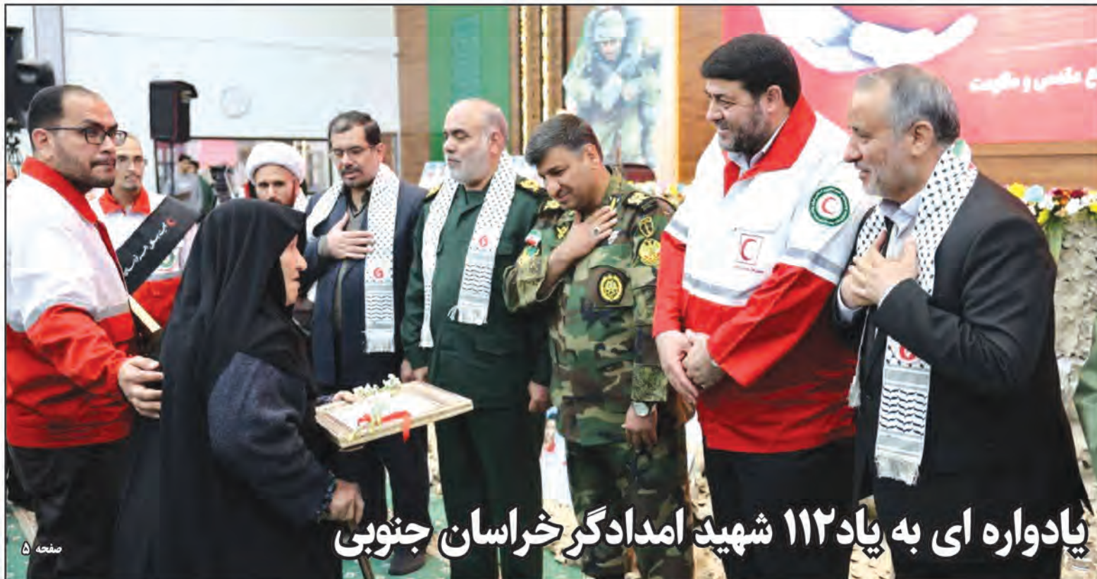
یادواره ای به یاد ۱۱۲ شهید امدادگر خراسان جنوبی

نرخ دلار نیمایی که در معاملات روز پنجشنبه هفته گذشته به ۷۰ هزار تومان رسیده بود، در معاملات دیروز یکشنبه مرکز مبادله به ۶۸ هزار تومان برگشت. به گزارش ایرنا، نرخ ارز نیمایی در پایان معاملات دیروز (یکشنبه، ۱۶ دی) مرکز مبادله ارز و طلای ایران اعلام شد که بر اساس آن نرخ اسکناس دلار ۶۸ هزار و ۷۴ و نرخ حواله دلار ۶۶ هزار و ۲۲۰ تومان تعیین شد. همچنین اسکناس یورو با نرخ ۷۰ هزار و ۱۹۰ و حواله یورو ۶۸ هزار و ۲۷۸ تومان به خریداران عرضه شد. هر درهم امارات ۱۸ هزار و ۵۲۶ و یکصد دینار عراق پنج هزار و ۱۹۵ تومان کشف قیمت شدند. همچنین در بازار دیروز تهران هر قطعه سکه طرح جدید با کاهش ۴۳۶ هزار تومانی نسبت به دیروز، ۵۵ میلیون و ۳۰۰ هزار تومان و طرح قدیم نیز با افت ۱۵۴ هزار تومانی، ۵۴ میلیون و ۱۰۰ هزار تومان فروخته شد. نیم سکه کاهش ۲ هزار و ۵۰۰ تومانی داشت و ۳۱ میلیون و ۲۰۰ هزار تومان عرضه شد. ربع سکه هم ۱۷ میلیون و ۶۰۰ هزار تومان به مشتریان واگذار شد.