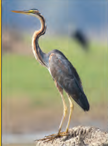
سلام بی رمق کجی به مهاجران سیبری