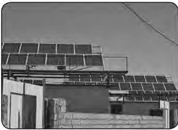
از روزهای آفتابی استان می تواند بسیار بیشتر از این مبلغ باشد. به گفته مدیرعامل شرکت توزیع نیروی برق استان در این مدت، ۱۳ میلیون و ۵۰۰ هزار

نیروگاه های کوچک مقیاس و مردمی استان برق تولید می کنند. به عنوان مثال در شهرستان بشرویه ۱۸۴ نیروگاه خانگی فعال است و این شهرستان بیشترین تعداد نیروگاه های خورشیدی را دارد. اشتغال قابل توجهی با ایجاد این نیروگاه ها در استان ایجاد شده و درآمد خانوار افزایش یافته است. مدیرعامل شرکت توزیع نیروی برق استان درباره نحوه خریداری برق تولیدی گفت: برق خورشیدی تولید شده در نیروگاه های خانگی توسط ساتیا (شرکت انرژی های تجدیدپذیر ایران) از صاحبان این نیروگاه ها خریداری می شود. بنا بر گفته دلاگر از ابتدای سال تاکنون ۲۸۸ نیروگاه برق خورشیدی با ظرفیت ۲ هزار و ۲۵۰ کیلو وات راه اندازی شده است.