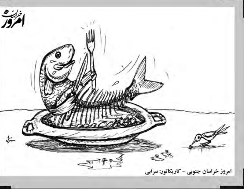
امروز خراسان جنوبی - کاریکاتور: سرابی