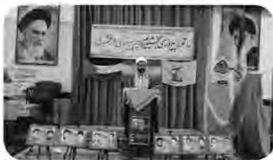
امروز خراسان جنوبی - گروه خبر

امام جمعه خوسف در جمع نمازگزاران جمعه در هیئت حسینی خوسف ضمن تبریک به جبهه مقاومت گفت: یک گروه کوچکی به نام حماس و مردم مؤمن به کمک مقاومت و ایستادگی توانستند بر استکبار جهانی و حامیان آنها پیروز شوند که این فتح المبین و یک پیروزی بزرگی است که شکر خدا را می طلبد و پیروزی نهایی از آن جبهه مقاومت و خاندان با صابرین است. حجت الاسلام اسماعیلی گفت: توافق و آتش بس به همگان فهماند این پیروزی نمره مذاکره نیست بلکه نمره واقیت‌های میدانی است که حتی صهیونیسم هم جرأت انکار آن را ندارد و نتایج‌هاو می‌می‌خواست حماس را حذف کند حالا یک طرف آتش بس حماس است و این یعنی حماس را نیز به رسمیت شناخت، هیچ کدام از اهداف خیالی و املاتی نتایج‌هاو محقق نشد و شکست خورد و امروز روز مجازات این جنایتکار است و پیروز میدان فلسطین است و این توافق نه تنها پایان کار نیست بلکه آغاز فصلی جدید است که منجر به پیروزی فلسطین و آزادی قدس شریف خواهد شد. خطیب جمعه خوسف با اشاره به روز گرامیداشت شاهچراغ گفت: زبرجسته ترین نقاط حضرت احمد ابن موسی الکاظم همراهی و حمایت از امام هشتم (ع) است و به همین دلیل وفاداری و ولایت‌مداری از ایشان بعنوان ابوالفضل العباس امام رضا یاد می‌کنند. وی در پایان ضمن تشکر از عوامل اجرایی اعتکاف در شهرستان خوسف گفت: خیرین، فعالین فرهنگی، جوانان و نوجوانان به شکوه اعتکاف افزودند و این یک سرمایه معنوی است که باید این سرمایه معنوی را حفظ کنیم.