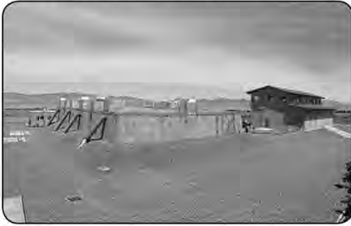
که در فاز دوم همه روستاهای بالای ۲۰ خانوار خراسان جنوبی آبرسانی شود.

امروز خراسان جنوبی- گروه خبر مدیرعامل شرکت آب و فاضلاب خراسان جنوبی گفت: با اجرای طرح جهاد آبرسانی که در استان در حال اجراست آب ۶۷ روستای خراسان جنوبی به مرحله پایبندی رسید. عملیات اجرایی آبرسانی به ۴۹ روستای خراسان جنوبی در هفتمین روز از دهه مبارک فجر سال ۱۴۰۰ در شهرستان مرزی درمیان آغاز شد. در این مراسم طرح های آبرسانی به ۴۸۰ روستا و برق رسانی به ۲۱۱ روستا به طور رسمی افتتاح و دستور آغاز عملیات اجرایی طرح جهاد آبرسانی به ۱۰ هزار روستا در کشور توسط رئیس جمهور شهید صادر شد. طرح جهاد آبرسانی با پیگیری استاندار خراسان جنوبی و مسئولان مرتبط در قالب ۲ قرارداد و یک تفاهم نامه عملیاتی شد که در قرارداد اول آبرسانی به ۱۱۵ روستای استان در دستور کار قرار گرفت و این طرح با پیشرفت فیزیکی ۷۵ درصد در دست اجراست.