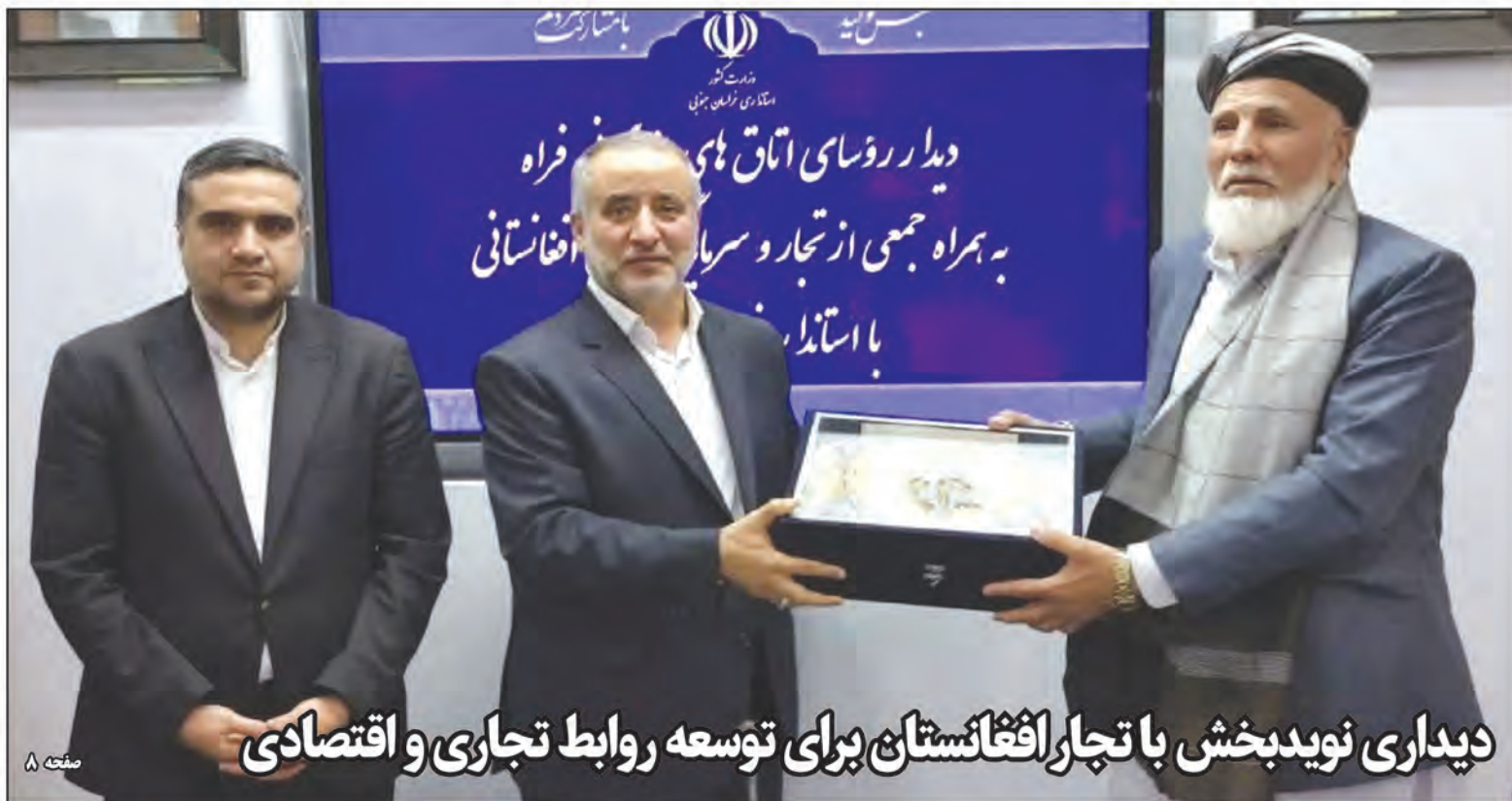
دیداری نویدبخش با تجار افغانستان برای توسعه روابط تجاری و اقتصادی