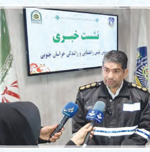
افزایش شده و گواهینامه دریافت کرده اند؛ گفت: از ابتدای سال شده و تمام فرآیند آن غیرحضوری بوده و با هزینه کمتر و سریعتر

قانون گذار در بحث ترافیک، نقش این سازمان‌ها را چه در حوزه‌های فرهنگ سازی، پشتیبانی، اجرایی و نظارتی مشخص کرده و سهم پلیس، کنترل ترافیک در معابر، رسیدگی به تصادفات رانندگی در کنار موارد خدماتی ( صدور گواهینامه + شماره گذاری وسایل نقلیه و...) می باشد. ۶۵۰ هزار تذکر به جای جریمه سرهنگ رضایی اظهار داشت: از ابتدای سال بیش از ۶۵۰ هزار تذکر به جای جریمه انجام شده است و همچنین بیش از ۵۸۷ هزار خدمت به هم استانی‌ها در حوزه‌های شماره گذاری، اجرائیات، صدور گواهینامه و بحث تصادفات ارائه