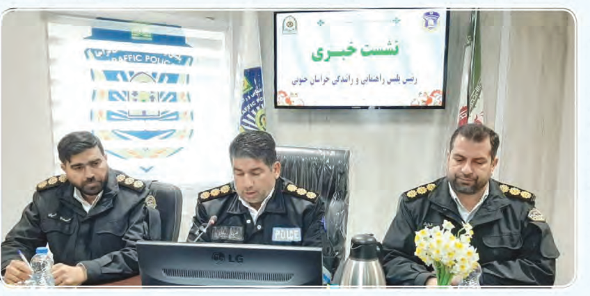
شده است. وی با اشاره به اینکه ۱۵ هزار و ۲۴۸ راننده به رانندگان استان انجام می شود و تاکنون تعداد ۵۸۳ گواهینامه آسان موتورسیکلت در استان صادر گردیده است. وی خاطرنشان کرد: پلیس راهنمایی و رانندگی در کنار سایر وظایف، به آموزش قوانین و مقررات هم توجه جدی داشته است که در این ارتباط آموزش شهروندان در محافل عمومی (مدارس، مهدها، مساجد و...) و آموزش از طریق صداوسیما و همچنین آموزش و اطلاع رسانی مستمر در فضای مجازی که به صورت روزانه در حال انجام است می توان نام برد.

امروز خراسان جنوبی - گروه خبر رئیس پلیس راهنمایی و رانندگی استان گفت: از ابتدای امسال تاکنون ۱۱ هزار و ۸۶۷ فقره تصادف درون شهری در خراسان جنوبی به وقوع پیوسته که برابر اعلام پلیس راهنمایی و رانندگی کشور؛ خراسان جنوبی امسال رتبه سوم کشوری در کاهش تصادفات را داشته است. به گزارش خبرنگار خبرگزاری پلیس، سرهنگ «علیرضا رضایی» در نشست خبری با خبرنگاران و اصحاب رسانه با اشاره به اینکه یکی از شعارهای پلیس راهور این می باشد که راه راننده متخلف از راننده قانونمند جداست؛ اظهار داشت: به شدت با خودروهای هنجارشکن برخورد می کنیم و از طرفی قردادان رانندگان قانونمند هستیم و همچنین در این ارتباط روزهای دوشنبه را به عنوان روز رانندگان قانونمند معرفی کرده و هر هفته به ۱۰۰ نفر از رانندگان قانونمند گل اهدا می شود و ۱۸۰ کلاه ایمنی هم بین موتورسواران قانونمند توزیع شده است. اجرای طرح میز خدمت مجازی وی بیان داشت: در راستای خدمت رسانی سریع‌تر و بهتر به شهروندان طرح میز خدمت مجازی را اجرایی کردیم و تاکنون سه مرحله برگزار شده است که در این ۳ مرحله بیش از ۵۱۱ درخواست، پیشنهاد و انتقاد شهروندان بررسی و در صورت نیاز پیگیری شده است و مشکلات ۹۸ نفر از شهروندان بدون مراجعه حضوری انجام شده است. این مقام انتظامی خاطرنشان کرد: پلیس راهور به عنوان خدمتگزار مردم، از آنجایی