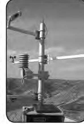
مدیرکل هواشناسی خراسان جنوبی گفت: پنج ایستگاه اقلیم شناسی و