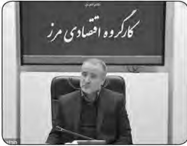
هر جلسه کارگروه اقتصادی مرز باید به موضوع تخصصی و اولویتدار با حضور مدیران مربوطه برگزار شود و مصوبات لازم...