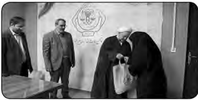
خانواده های زندانیان است. مدیر کل زندان های خراسان جنوبی هم گفت: هر هفته در قالب نذر هشتم امام رضایی از خانواده زندانیان نیازمند سرکشی می شود که در این دیدارها حمایت مالی و معیشتی، خدمات حقوقی و مشاوره، حمایت از فرزندان زندانیان، کمک های بهداشتی و درمانی و اشتغال خانواده زندانیان نیز صورت می گیرد. عیدی افزود: از ابتدای امسال ۶۶ زندانی که شرایط ستاد دیده را نداشتند با مبلغ ۷۰۰ میلیون تومان توسط انجمن حمایت بیرجند آزاد شدند.

۴۶۰ سبد کمک معیشتی در قالب پوشش فجر بعثت، بین خانواده زندانیان بیرجند توزیع شد. دادستان عمومی و انقلاب مرکز استان گفت: در قالب این پوشش طرح توزیع سبدهای کمک معیشتی به ارزش ۵۰۰ میلیون تومان بین خانواده های زندانیان نیازمند اجرا شد. حجت الاسلام نسائی زهان افزود: این طرح با همکاری مدیر کل زندان های استان خراسان جنوبی، انجمن حمایت زندانیان و خیرین نیک اندیش انجام شده و هدف آن کاهش بار اقتصادی بر دوش