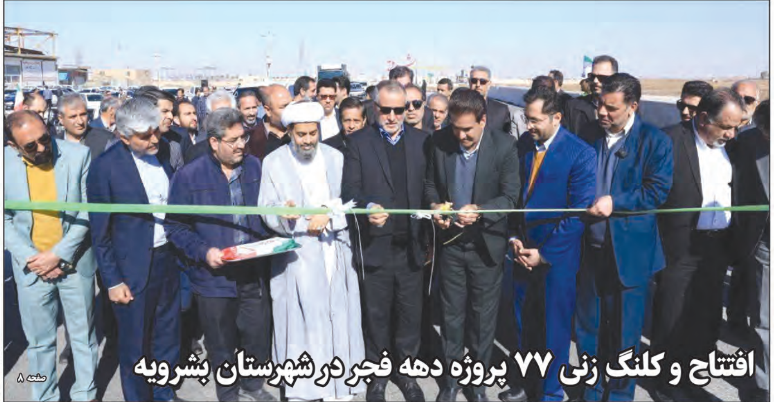
افتتاح و کلنگ زنی ۷۷ پروژه دهه فجر در شهرستان بشرویه