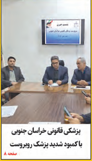
پزشکی قانونی خراسان جنوبی با کمبود شدید پزشک روبروست