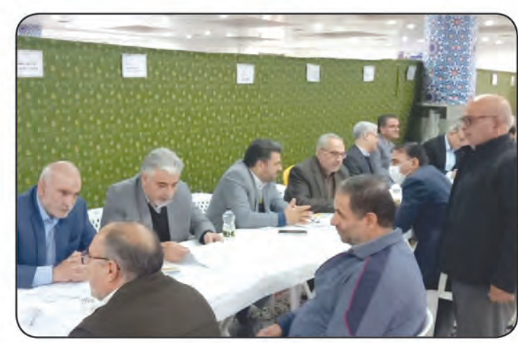
میز خدمت مصلی نماز جمعه بیرجند