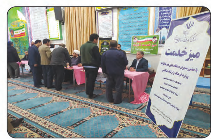
مسجد چهارده معصوم فردوس