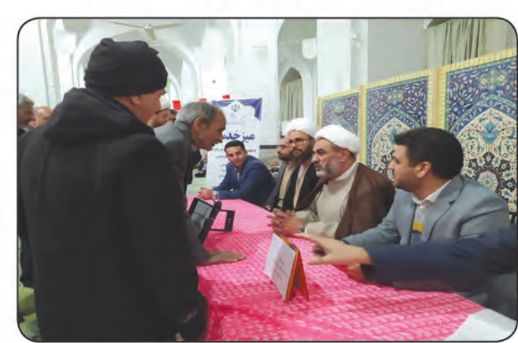
میز خدمت مسجد جامع طبس