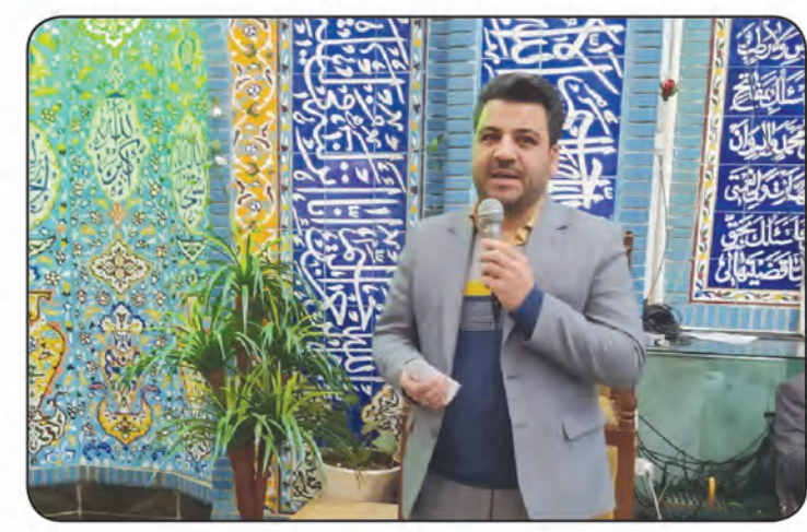
میز خدمت مسجد غدیر قائین