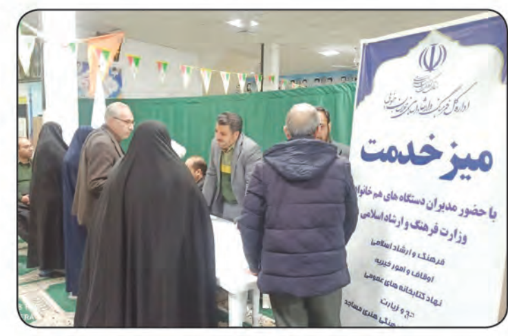
میز خدمت مسجد سیدالشهدای بیرجند