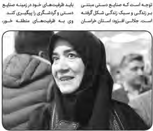
جنوبی با توجه به وجود روستای جهانی خراشاد در زمینه تویافی و همچنین روستای جهانی اصفهک