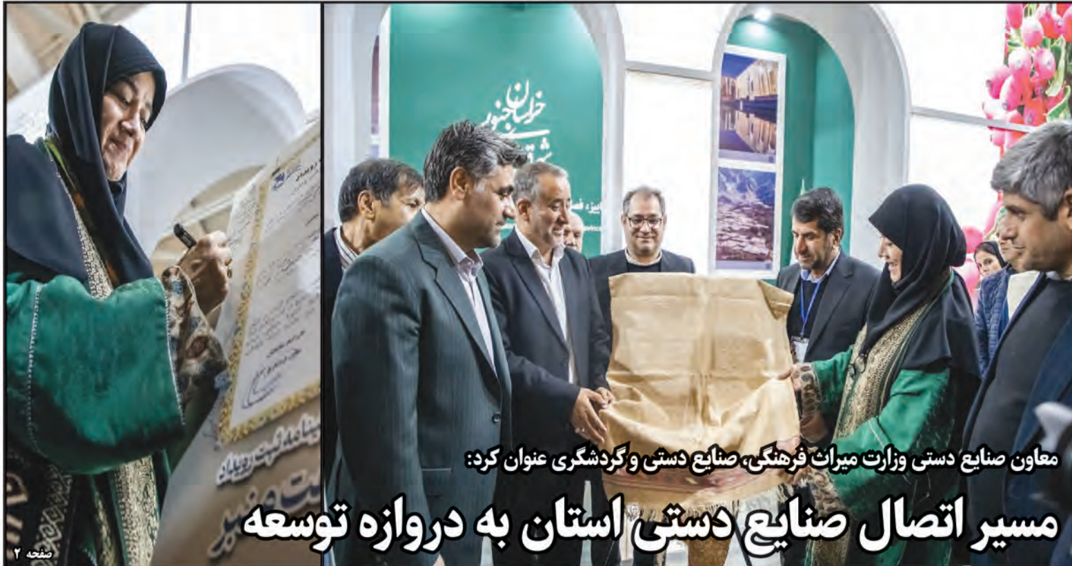
معاون صنایع دستی وزارت میراث فرهنگی، صنایع دستی و گردشگری عنوان کرد:

مسیر اتصال صنایع دستی استان به دروازه توسعه