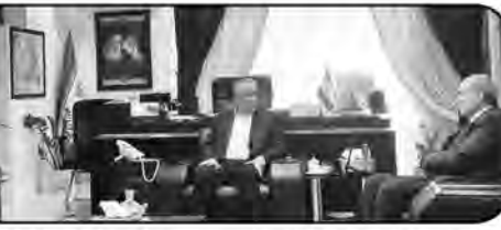
در استان‌ها بر اساس سرمایه‌گذاران بومی است و در صورتی که سرمایه کم باشد به سرمایه‌گذاران کمک می‌کنیم. استاندار خراسان جنوبی است دیدار گفت: خراسان جنوبی استانی

محروم نیست بلکه کمتر توسعه یافته است که با توجه به ظرفیت‌های این استان، از صندوق توسعه ملی تقاضا داریم سرمایه‌گذاران را در استان یاری کند. هاشمی افزود: وجود بزرگترین ذخیره زغال سنگ دنیا و ۲ هزار و ۶۰۰ اثر تاریخی با ۱۰ اثر ثبت جهانی و سه محصول استراتژیک زعفران، زرشک و عناب از جمله ظرفیت‌های منحصربه‌فرد خراسان جنوبی است که باید برای سرمایه‌گذاری در اولویت قرار گیرد.