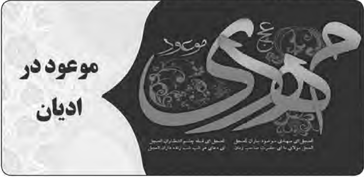
سبب ای مهدی موعود بران گنبد

بر این اساس، عیسی (ع) دوباره ظهور خواهد کرد و به تصریح عبارات عهد جدید (یا اناجیل چهارگانه و برخی متون وابسته به آن)، با حاکمان ستمکار خواهد جنگید و پس از نابود کردن آنها بشر را به ساحل نجات و رستگاری رسانده و به زندگی آرمانی اش جامهٔ