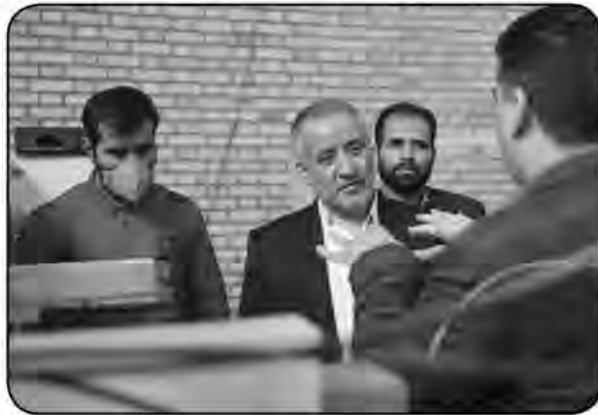
زمینه تسهیلات بوده و تا جایی که مقدور باشد تسهیلات تبصره ۱۸ به صورت هفتگی به این مشکلات

هاشمی افزود: مشکلات واحدهایی که تاکنون بازدید شده بیشتر در حال پرداخت است و در کارگروه