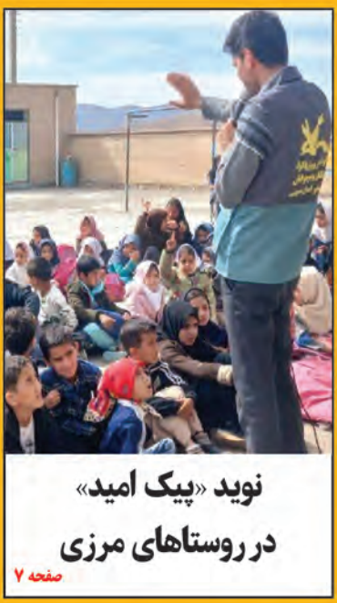
نوید «پیک امید» در روستاهای مرزی صفحه ۷