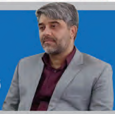
۹ هزار یتیم استان نیازمند حمایت صفحه ۲

سال بیست و یکم شماره ۵۵۱۷ سه شنبه ۳۰ بهمن ۱۴۰۳ ۱۹ شعبان ۱۴۴۶ ۱۸ فوریه ۲۰۲۵ قیمت: ۵۰۰۰ تومان