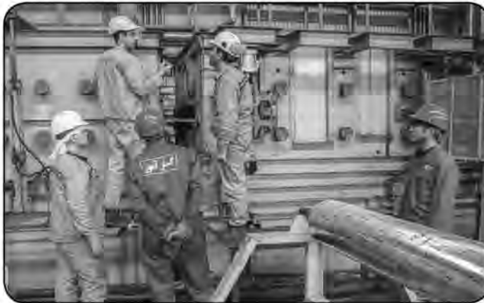
مدیرکل فنی و حرفه ای خراسان جنوبی خدمت برای او صادر نمی شود. چوب جایگزین رشته برق برای ادامه داد، در محیط کار واقعی صنایع

مدیرکل آموزش فنی و حرفه ای استان گفت: در حوزه آموزش مهارتی مشکل فرهنگی در استان داریم که باید ذهنیت موجود در این خصوص اصلاح شود. کامرانی فر افزود: افرادی دارای مهارت تنها با شرکت در آزمون برای دریافت گواهینامه می توانند اقدام کنند. او با بیان اینکه در قالب ۱۹ گروه هدف آموزش های مورد نظر انجام می شود، افزود: در حوزه آموزش سربازان وظیفه بالاترین گروه متقاضی آموزش در حوزه صنایع خودرو است و برق و الکترونیک بعد از آن قرار دارد و هر سرباز باید یک گواهینامه مهارتی تا پایان خدمت بگیرد در غیر این صورت کارت پایان