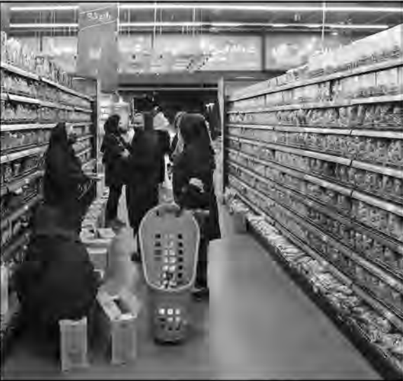
ضعیف کمک کند اما برای مقابله با تورم به‌طور پایدار، دولت باید به دنبال راه‌حل‌های بلندمدت و ساختاری باشد که شامل کنترل نقدینگی، کاهش کسری بودجه و ایجاد تولید پایدار است.