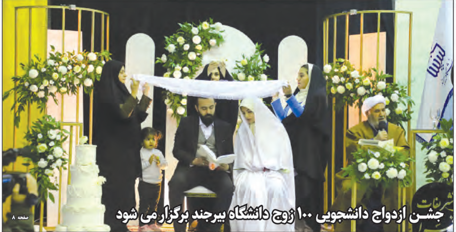
جشن ازدواج دانشجویی ۱۰۰ زوج دانشگاه بیرجند برگزار می شود

جاده های ۲۳ استان کشور در گیر برف و یخبندان است جانشین پلیس راه فراجا گفت: در ۲۳ استان به ویژه در جاده های کوهستانی شاهد بارش برف و باران و به دنبال آن یخبندان هستیم. سرهنگ سیاوش محبی در گفت و گو با خبرنگار ایرنا اظهار داشت: سطح جاده ها کاملاً لغزنده است و در ارتفاعات محورهای کوهستانی مه غلیظ باعث کاهش دید افقی رانندگان وسیله نقلیه عبوری شده است. وی افزود: تا این لحظه با تلاش همکاران سازمان راهداری هیچ یک از جاده ها به واسطه بارش برف و باران و یا نایمن بودن مسدود نشده است. این مسئول با بیان اینکه تمام جاده ها باز است، خاطرنشان کرد: شرایط مناسبی برای سفر کردن به ویژه در تاریکی شب نیست و توصیه می کنیم رانندگانی که قصد سفر دارند، سفر خود را تا صبح به تعویق بیندازند. سرهنگ محبی تأکید کرد: در صورت ضرورت سفر، رانندگان حتماً تجهیزات زمستانی و ایمنی به ویژه زنجیر چرخ، پوشاک گرم، تغذیه و مواد غذایی را به همراه داشته باشند.