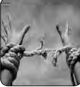
این تصمیم آنها از لحاظ معنوی بسیار ارزشمند است.

فرمانده انتظامی شهرستان بیرجند از پلمب ۲ پاتوق مصرف مواد مخدر و یک ضایعاتی در راستای ارتقاء امنیت اجتماعی در این شهرستان توسط مأموران خبر داد. سرهنگ احمدرضا کارگر ادامه داد: مأموران کلانتری ۱۳ و ۱۴ شهرستان بیرجند در راستای ارتقاء امنیت اجتماعی و با اطلاع از پاتوق مصرف مواد مخدر و برپا کردن مکان خرید ضایعات در این شهرستان، پیگیری و بررسی موضوع را در دستور کار قرار دادند. به گفته وی مأموران با انجام اقدامات اطلاعاتی و تحقیقات گسترده میدانی مناطق آلوده و جرم‌خیز را شناسایی و با هماهنگی مقام قضایی محل‌های شناسایی شده را بازرسی کردند که با دستور مقام قضایی ۲ پاتوق فروش و مصرف مواد مخدر و همچنین یک ضایعاتی در این ارتباط پلمب گردید که پرونده تشکیل و برای انجام اقدامات قانونی به مرجع قضایی تحویل داده شد.