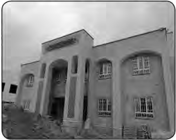
حاصل و نقل و احداث راه، ۱ طرح احداث آزمایشگاه تخصصی دامپزشکی، ۴ طرح آموزش و پرورش و علم و فناوری، ۶ طرح

سال از محل مالیات های دریافتی باید تکمیل شود. به گفته وی سازمان ۲۶ طرح برای استان اعلام کرده که ۲ طرح در