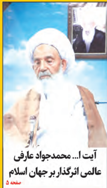
آیت ا... محمدجواد عارفی عالمی اثرگذار بر جهان اسلام صفحه ۵

آغاز طرح راهداری نوروزی از ۲۵ اسفند در سطح محورهای خراسان جنوبی