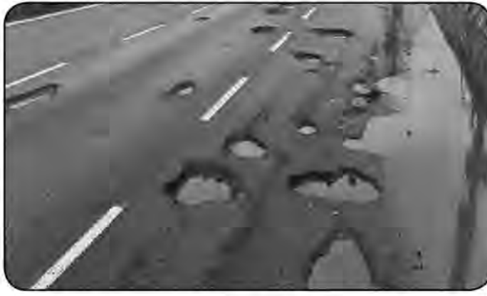
از وضعیت این جاده به امروز خراسان جنوبی نوشتند: چاله ها و ناهمواری ها در جاده دیهوک و گاه این خرابی های شدید در آسفالت، کنترل

امروز خراسان جنوبی-صادقی جستجوی ساده درباره حوادث محور خور- دیهوک نتایج تأمل برانگیزی دارد: «حادثه رانندگی در محور خور به دیهوک ۲۱ مصدوم بر جای گذاشت. برخورد اتوبوس با وانت یخچالدار در محور خور به دیهوک، باعث این اتفاق شد. محور دیهوک به دیگر نقاط از جمله خور، راور، طبس، کرمان و ... یک سمت پرتکرار تصادفات جاده ای خطرناک و حتی منجر به مرگ است. می شود گفت همیشه پای دیهوک در میان است. محور این منطقه به رسیدگی و ترمیم و در برخی نقاط زیرسازی اصولی نیاز دارد و هر چند عامل انسانی در برخی تصادفات اعلامی نقش دارد اما آنچه این عامل را تقویت می کند نقص های جدی و غیر قابل اقصای جاده است. رانندگانی که در این محور تردد دارند با گلایه